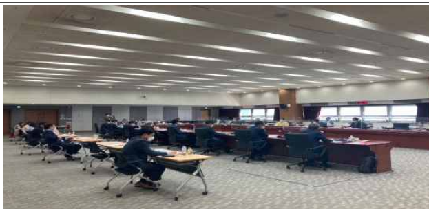
삼교천권역 종합발전전략 연구 중간보고회(20. 12. 24)