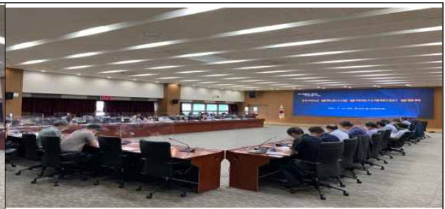
2040년 행정중심복합도시 광역도시계획 수립 연구 설명회(6. 22)