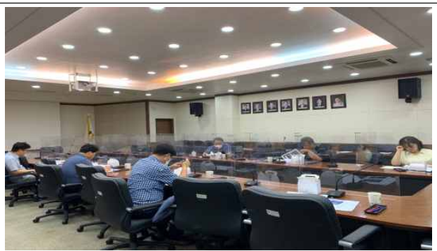
양극화대응정책연구단 세미나(6. 28)