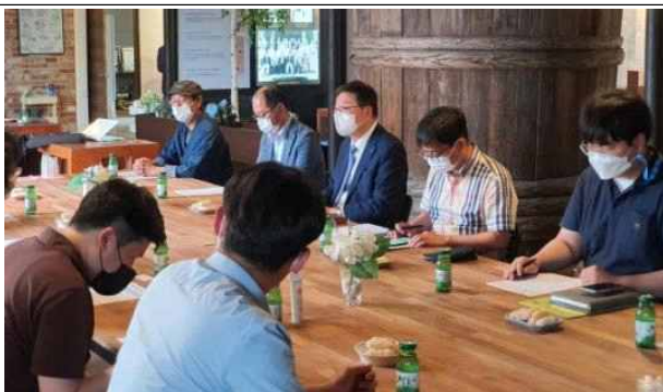
농산어촌유토피아연구단 현장 방문(6. 8)