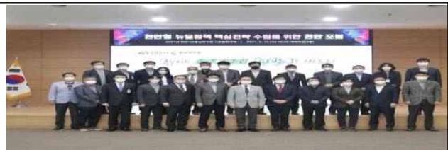
천안시 정책간담회(4. 14)