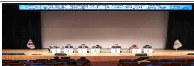
당진시 정책간담회(5. 26)