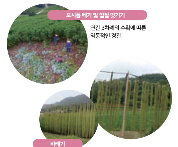
모시풀 베기 및 겉질 벗기기