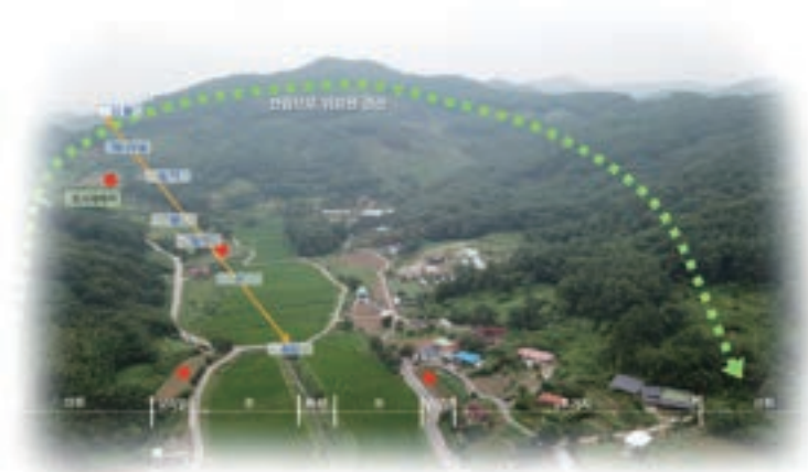
산림~방풍림~모시재배지~마을~논밭으로 이어지는 모시농업 경관