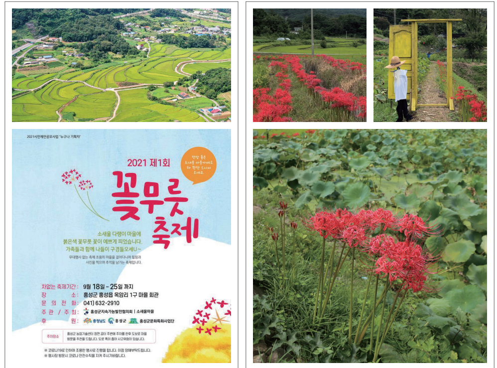
소새울마을(위)과 축제 홍보자료(아래)