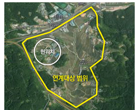
농업·농촌 복합경관 확대 범위(안)