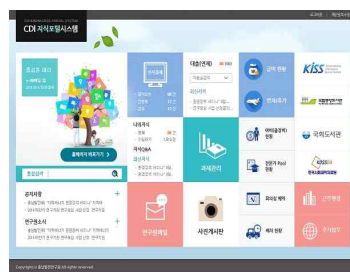
< CIPS 도식도 >