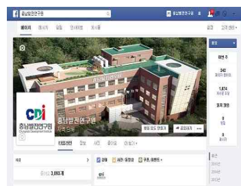
< SNS-페이스북 >