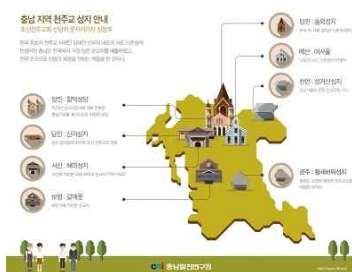
< 인포그래픽 >