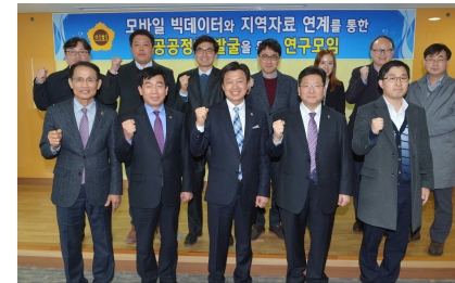
빅데이터와 지역자료 연계 공공정책발굴을 위한 연구모임 (3.27)