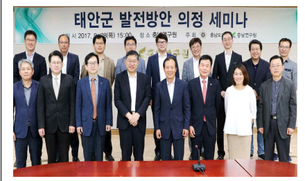
태안군 발전방안 의정세미나(9.28)