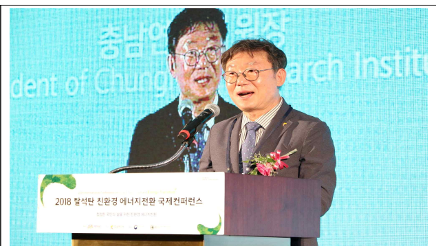
탈석탄 친환경 에너지 전환 국제컨퍼런스(10.1-2)