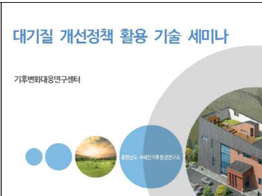
대기질 개선정책 활용세미나 (4.25)