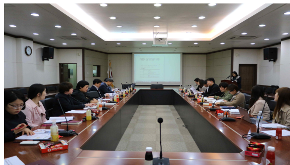
석탄화력발전소 주변지역 관련 워크숍(3.30)