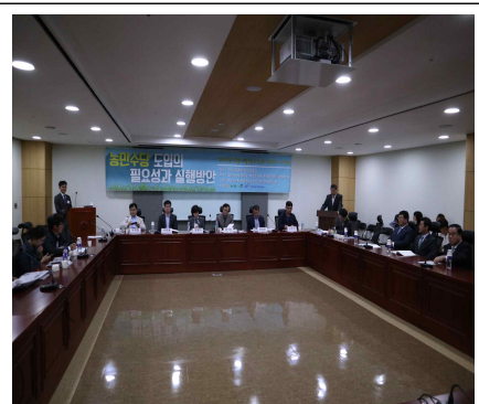
농민수당 도입 국회토론회(5.4)