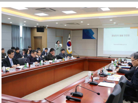
충남의 미래발전 포럼(3.20)

- 내포혁신도시(내포신도시 공공기관 이전), 국가혁신클러스터, 농민수당 도입, 농촌재생 등 충남의 주요 이슈에 대한 당위성과 타당성 논리 발굴