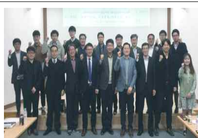
서해안기후환경연구소 개소 3주년 기념식 및 간담회(3.27)