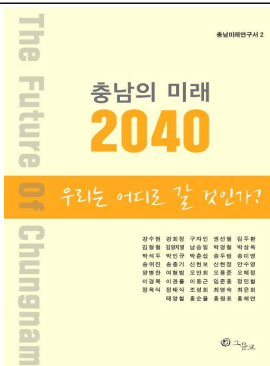
충남의 미래 2040 II