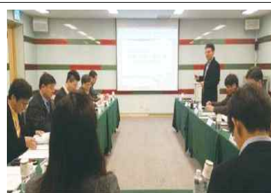
지역 기후변화 전문가 협의체 회의(3.15~16)