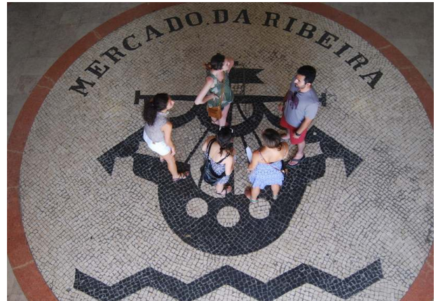
<입구 바닥의 심볼>