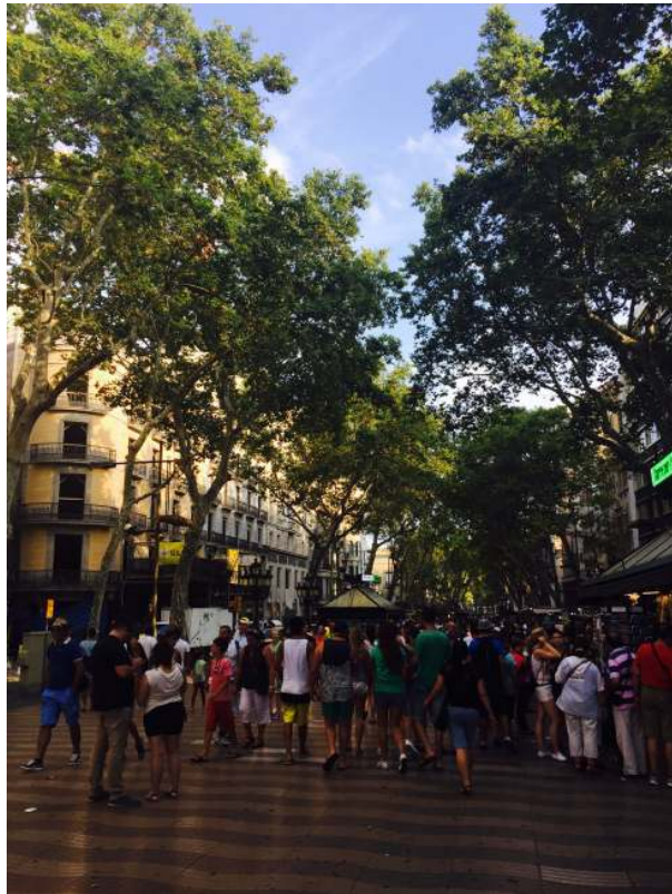
<람블라스 거리와 공존>