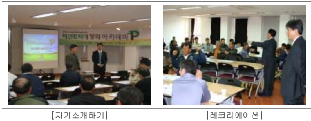
<사진 3-1> 자연스러운 교육 분위기 연출