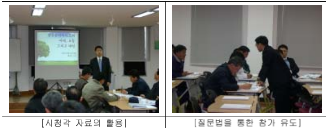
<사진 3-2> 강의식 교육의 전개