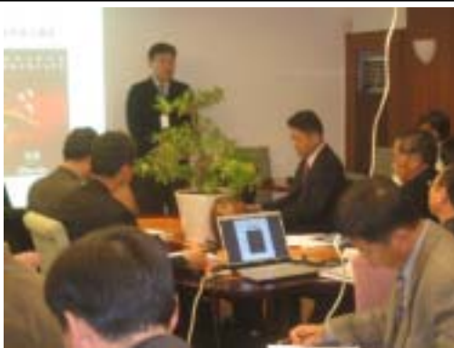
[특산품의 차별화 성공사례 견학]