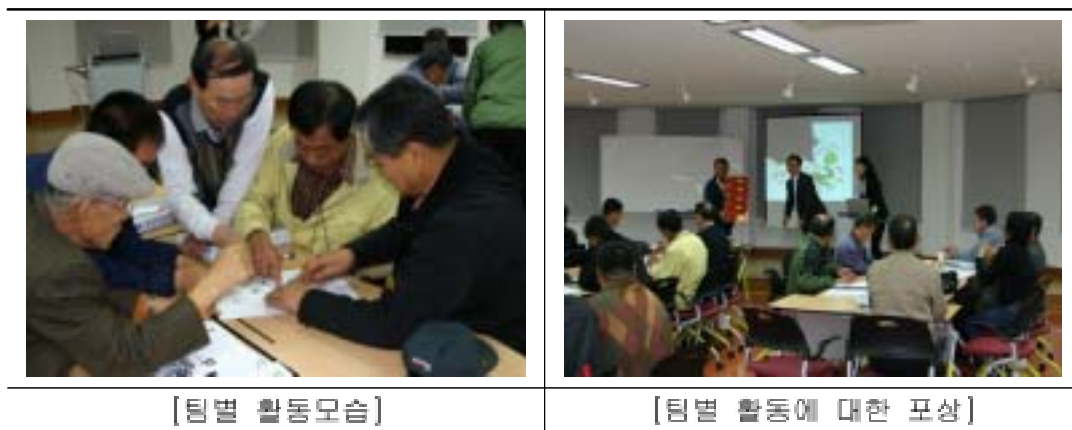
<사진 3-3> 팀별 활동