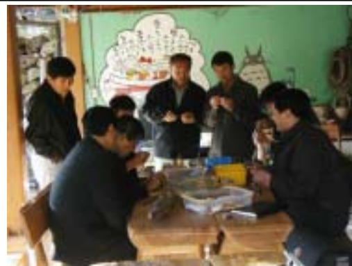
[마을 만들기 해외 선진지 견학]