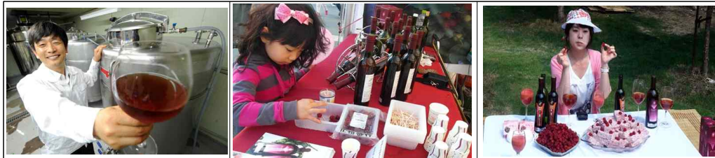
<그림4> 김해 산딸기

산딸기라는 틈새작목으로 새로운 소득원을 개발하여, 2010년에는 700여 톤 생산에 50억 원이라는 농가소득을 올림. 부지 9.3ha에 산딸기 대표단지인 비가림 하우스 177동을 설치. 출하조절, 노동력 분산방식으로 수확하고, 수확 후 신선도 유지를 위해 소형 예냉 시설 58개소를 설치. 상품 개선 시범지 16개소 등 과학관리. 가공·유통 및 냉장보관시설을 설치해서 과잉생산으로 인한 가격하락을 사전 대비함. 산딸기 와인, 산딸기 식초 등 다양한 가공품을 개발·생산하여 부가가치를 창출함