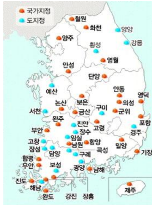
<그림 4> 살기좋은 지역만들기 선정지역