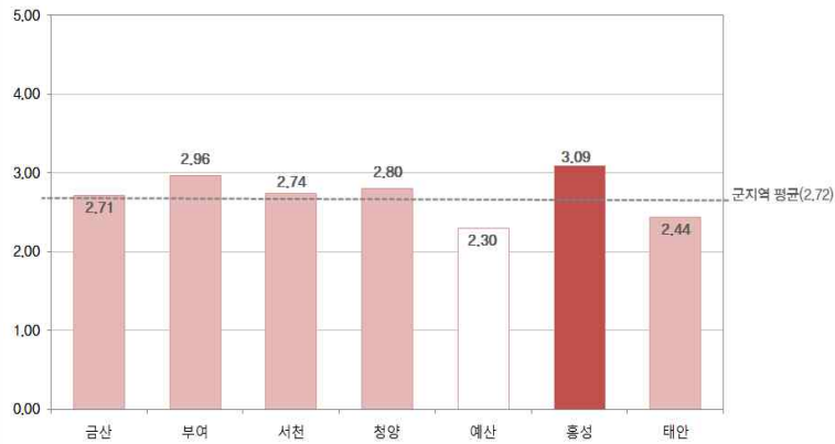
〔그림 3〕 군지역 응급서비스 부문의 만족도