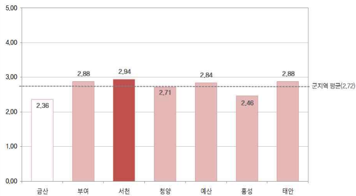
〔그림 4〕 군지역 문화여가부문의 만족도