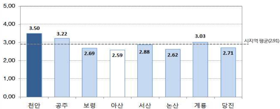
〔그림 2〕 시지역 교통 부문 만족도