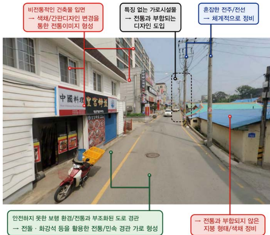
● 틀모시로 현황 및 줄다리기 문화거리 조성방향