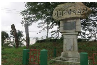
● 서낭 - 전통경관 형성