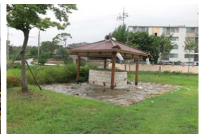
● 흥척동 우물 - 광장 및 전통경관 조성