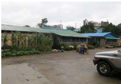
● 기지시 시장 내 열악한 줄제작장 주변 현황