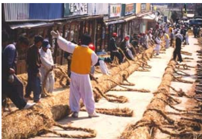
● 줄 제작 모습