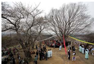
● 국수봉과 당제 모습 - 전통 공원 조성