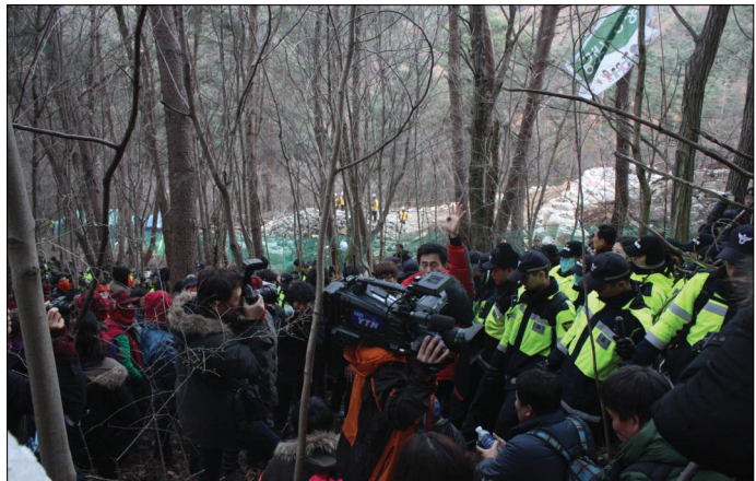
〈밀양송전탑 건설 강행 현장_대전충남녹색연합〉

우리 충남지역도 화력발전소 증설과 송전탑 건설문제로 갈등과 피해가 커지고 있다. 보령화력 주변 주민들은 날리는 석탄재와 석탄가루 때문에 밖에 빨래도 널지 못한다. 발전 온배수 1) 로 인한 해양생태계 교란도 심각해 어획량이 줄면서 어업인구도 줄고 있으며 회처리장(발전하며 태우고 남은 석탄재를 처리 공간)을 확보하기 위해 발전소 주변의 갯벌도 계속 매립되어 사라지고 있다.