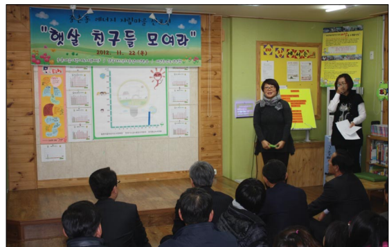
〈대전 중촌동 짜장어린이마을도서관에 설치되어 있는 태양광발전기, 주민설명회 _ 대전충남녹색연합〉