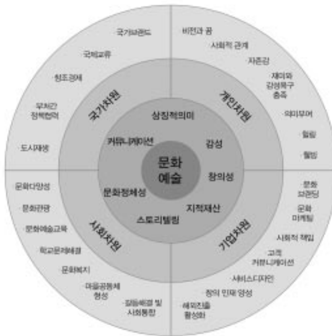
〈그림 1〉 문화예술의 창조적 활용 가치

자료 : 임학순·채경진, 2013, 「새 정부의 문화정책 이념과 발전방안」, 한국행정학회 춘계학술발표논문집, p1152.