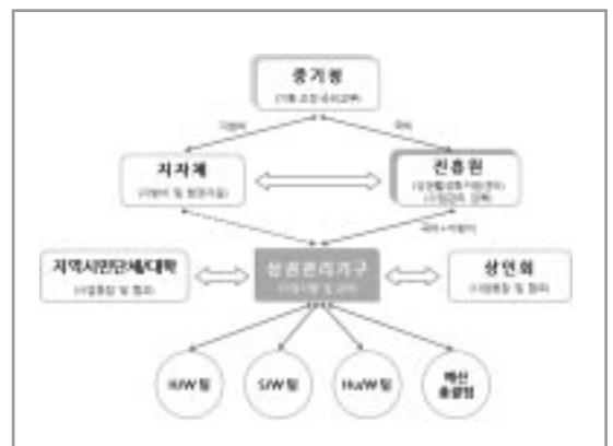
〈그림 3〉 관리기구운영도

축 및 추진 주체의 의지가 높은 지역을 우선하여 지정하고, 전통시장 또는 상점가가 1개 이상 포함되며, 매출액과 인구, 사업체수가 감소한 지역으로 400개 이상의 점포수가 충족된 지역이어야 한다(인구 50만 명 이상일 때 700개 이상의 점포수 충족). 시군구에서 활성화 구역을 지정 승인 후, 시도에서 승인을 검토하고 최종적으로 중기청에서 승인협약이 이루어진다. 상권활성화구역 지정 후 상권관리기구를 설치하여야 사업을 추진할 수 있으며, 상권관리기구는 비영리법인(사단, 재단)으로 설립하여야 한다. 또한, 상권관리기구 내 운영을 위한 사무국과 사업의 효율적이고 전문적인 추진을 위한 상권활성화협의회를 구성하여야 한다. 상권활성화 협의회는 상권활성화 사업의 효율적인 추진 및 자문을 위하여 상권활성화구역 안의 토지 등 소유자, 상인, 거주자 및 상권관리전문가(이하타운매니저) 등으로 구성된다.