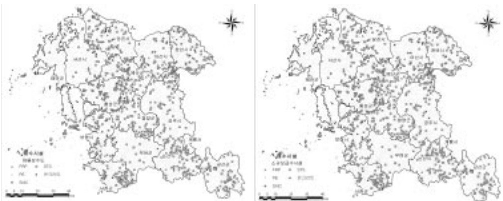
〈그림 6〉 충청남도 소규모수도시설 배수시설 분포현황

용하고 있다. 청양군은 소규모수도시설 대부분이 STS 배수조를 사용하고 있으며, PE 배수조는 아산시와 논산시, FRP 배수조는 천안시, 아산시, 콘크리트 배수조는 공주시, 서천군 등에서 많이 사용하는 것으로 조사되었다.