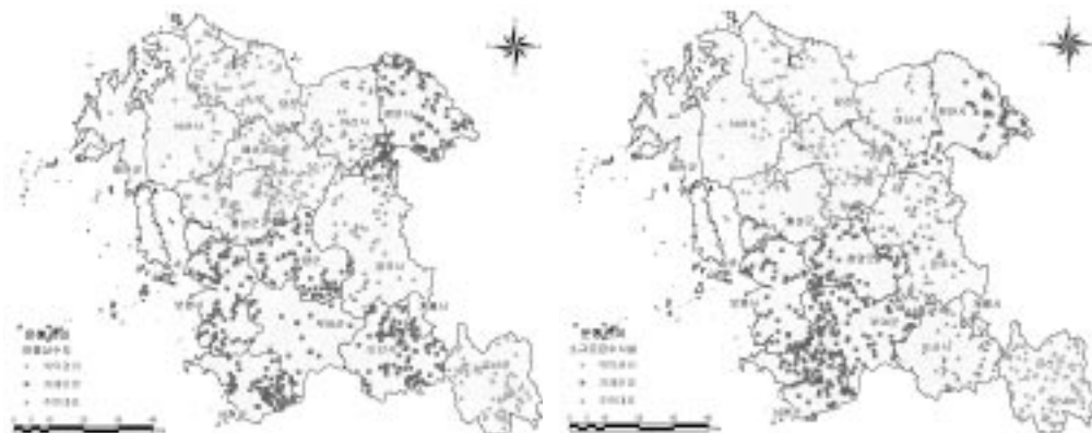
〈그림 8〉 충청남도 소규모수도시설 운영관리 분포현황

지 유형으로 운영·관리되고 있으며, 소규모수도시설을 자체 운영하는 비율이 약 45%로 가장 높고, 위탁관리가 약 34%, 주민대표가 약 21% 정도를 차지하는 것으로 나타났다.