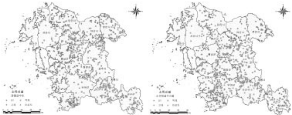
〈그림 5〉 충청남도 소규모수도시설 소독시설 분포현황

있는 것으로 나타났다. 일부 시·군에서는 소독시설로 자외선(UV)을 이용하고 있는 반면, 소독시설이 설치되지 않은 소규모수도시설이 존재하는 자치단체도 있는 것으로 파악되었다.