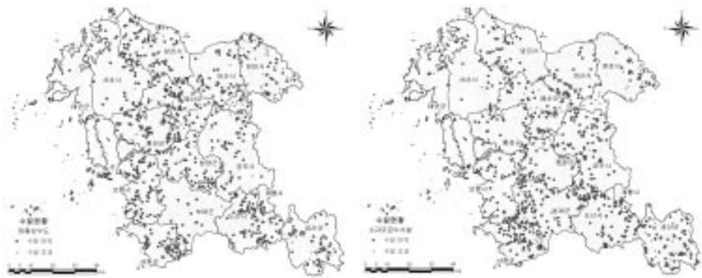
〈그림 7〉 충청남도 소규모수도시설 수질초과시설 분포현황

비소가 전체의 약 41%로 가장 많은 부분을 차지하였고, 다음으로 일반세균, 총대장균군, 질산성질소 순이었다. 천안시가 수질초과율이 가장 높았으며, 다음으로 태안군, 금산군 순인 것으로 나타났다.