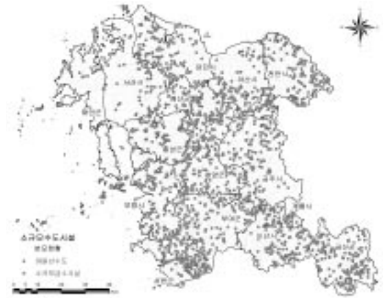
〈그림 1〉 충청남도 소규모수도시설 분포현황