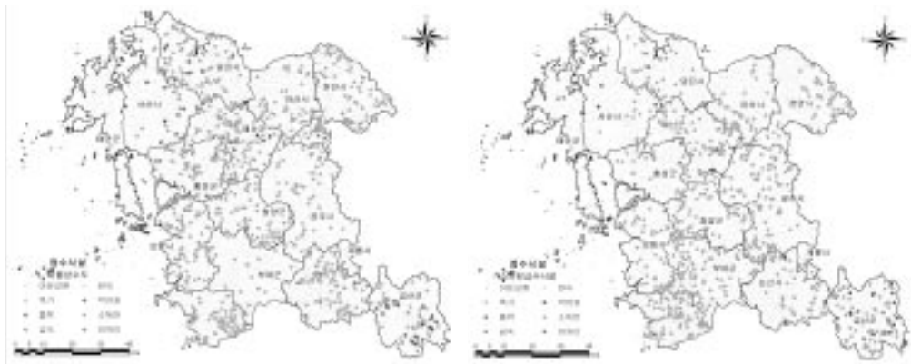
〈그림 4〉 충청남도 소규모수도시설 정수시설 분포현황

나타났다. 정수시설 가운데 완속 및 급속여과 시설은 천안시, 막여과시설은 금산군, 이온교환처리시설은 논산시, 흡착 및 폭기시설은 서산시, 논산시, 당진시 등에 설치되어 있는 것으로 조사되었다.