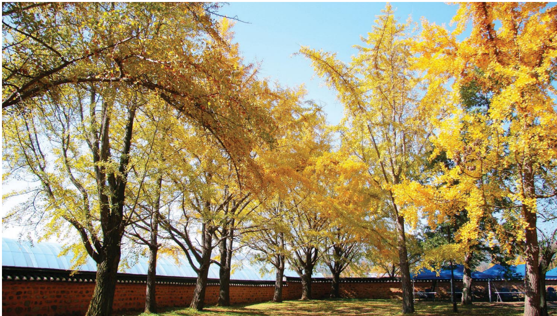
〈은행마을엔 은행나무 2천그루가 심어져 있다〉