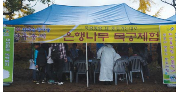
〈제1회 청라은행마을 단풍축제 모습〉