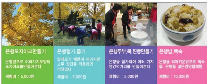
〈은행마을 특화 체험거리〉