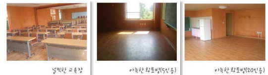
〈교육장은 80명까지 수용이 가능하며, 5인용 6개, 20인용 1실 등을 갖추고 있음〉

모델링해 체험객을 맞을 교육장과 사무실, 숙박 및 식당시설 등을 꾸며 은행마을 녹색농촌체험 사업을 개시하게 됐다. 현재 마을에 있는 약100여 가구 중 60% 정도가 이 마을사업에 참여하고 있으며, 이번 축제에는 거의 모든 가구가 참여하고 있다고 했다.