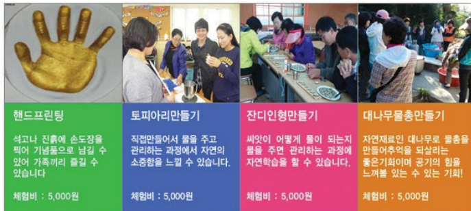
〈은행마을 상시 체험거리〉