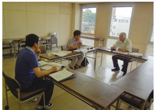
〈치바현 6차산업화서포트센터(NPO법인 치바농업네트워크)〉

둘째, 6차산업화 설명회 등 다양한 사업의 홍보가 서포트센터의 주요사업의 하나로 시행하고 있다. 설명회의 주요내용은 6차산업화 성공사례와