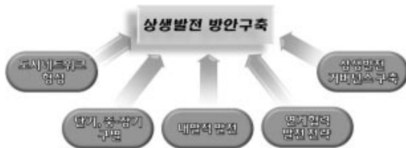
〈그림 2〉 상생발전의 계획 방향

다섯째, 상생발전을 위한 다원적 협의체를 구축하는 것이 필요하다. 세종시와 공주시의 상생협력을 위한 다원적 거버넌스 구축을 통해 협력사업 추진동력 확보, 사업추진체계 구축, 참여기관 역할 분담을 통해 공유 및 조율하는 방식으로 사업을 추진해야 한다.