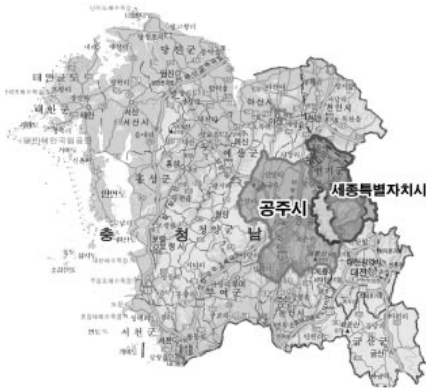
〈그림 1〉 대상지역

상의 도시네트워크 형성 방식으로 추진하는 것이 필요하다. 세종시 건설의 목적은 수도권 소재 중추행정 기능을 옮겨와 국토거점의 복합기능 도시를 구축하여 국토의 균형발전을 선도, 세종시 건설과 네트워크 광역도시권을 통해 국토 중심부에 새로운 국토발전 거점 형성에 있다. 세종시 네트워크 광역도시권 형성을 위해 공주시가 반드시 추진해야 하는 사업을 부각하고, 세종시의 미흡한 기능을 보완하기 위한 사업 위주로 추진해야 한다. 특히 중앙정부에 건의시 상생발전 사업은 국가적인 정책목표를 실현하기 위한 것으로 국비지원이 필요하다는 논리를 개발하는 것이 필요하다.