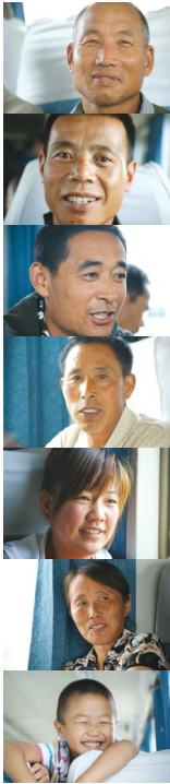
가차안에서 만난 중국인들

였다. 중국의 택시기사는 여러 곳에 전화를 해보고 4성급 호텔을 구했는데 가격이 생각보다 비싸다는 생각이 드는 차에 한국에 부탁한 친구가 마침 여행사에서 미리 예약한 3성급 호텔이 있어서 그 곳에 체류를 하면서 중국에서의 여행일정을 마무리 하였다.