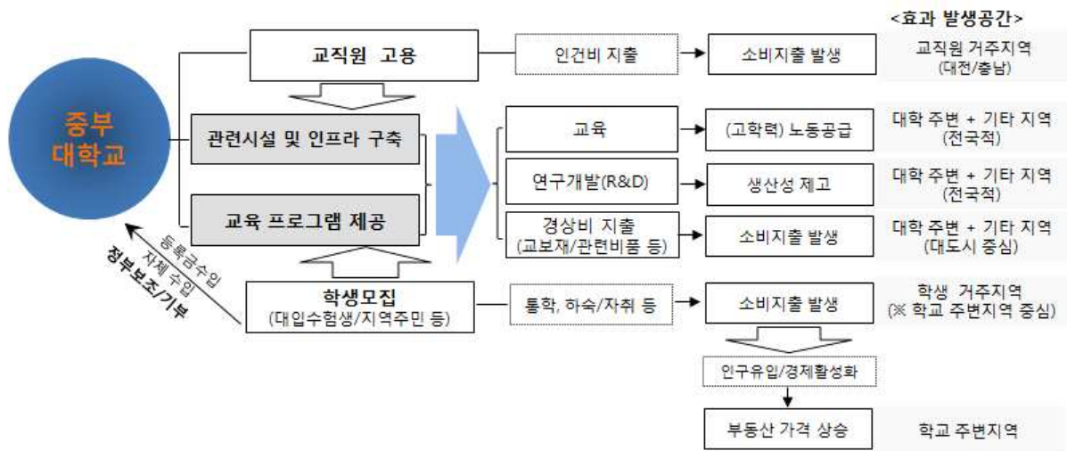
(그림 3) 대학교가 지역경제에 미치는 효과 구분