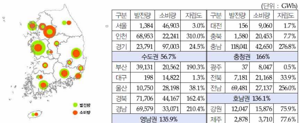
[표 2] 지역별 전력자립도(2011년)

앞서 제기된 문제점은 지역불균형을 만들어내는 경성에너지체제의 일반론에 가깝다. 그러나 그 이면에는 복잡하게 얽힌 실타래가 존재한다. 우선 최종에너지 중 전력의 공간적 문제점을 살펴보자. 충청권, 영남권, 호남권에서 전국 전력의 36.5%를 소비하는 수도권에 전력을 공급하는 형태가 발견된다. 12) 그러나 전력자립도가 56.7%에 불과한 수도권 내에서도 서울시와 경기도의 전력자립도는 각각 3.0%와 24.5%로 낮지만, 인천시는 310%로 전국에서 가장 높아 수도권 내에서도 지역 간 차이가 발생한다. 엄밀하게 말해서 전력수급과 공간적 불균형은 일차적으로 서울경기와 타지역간의 불균형인 것이다. 수도권에서의 전력생산과 소비의 불균형 현상을 다른 광역권 내에서도 찾아볼 수 있는데, 전력자립도가 100% 넘는 지역이 100% 미만인 지역에 전력을 공급하는 역할을 하고 있는 것이다. 13)