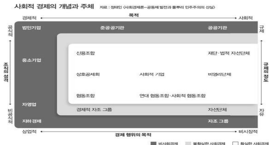
[그림 1] 사회적경제의 개념과 주체

이 조직들은 주로 자발적으로 결성되어 회원들의 출자나 회비를 기반으로 하며, 재화와 서비스를 생산 및 판매하는 경제 활동을 한다. 공제조합의 경우 회원 및 회원의 부양가족에 대한 서비스를 제공하나 협동조합이나 결사체, 재단 등은 회원을 넘어서 보다 넓은 범위를 대상으로 한다. 우선적 목표가 이윤이 아니라 구성원이나 지역사회 이익이라는 점은 경제 활동의 지향이 시장 경제와 다르며, 어쩌면 경제 활동은 특정한 목적을 달성하기 위한 일종의 도구일 수 있음을 의미한다. 독립적 운영은 정부로부터 보조금을 받거나 기업으로부터 후원을 받는다 하더라도 이들로부터 자율성을 지향한다는 의미이다. 민주적 의사 결정 역시 일반 기업처럼 자본이 의사 결정을 주도하는 방식과 대척점에 놓여 있는 원리이다. ‘1인 1표’나 대의원제도와 같은 방식이다. 소득배분의 방식은 조직 발전을 위한 수익금의 적립이나 사회적 기여를 목적으로 한 사용, 구성원에 대한 잉여 배당 등의 형식으로 주로 나타난다.