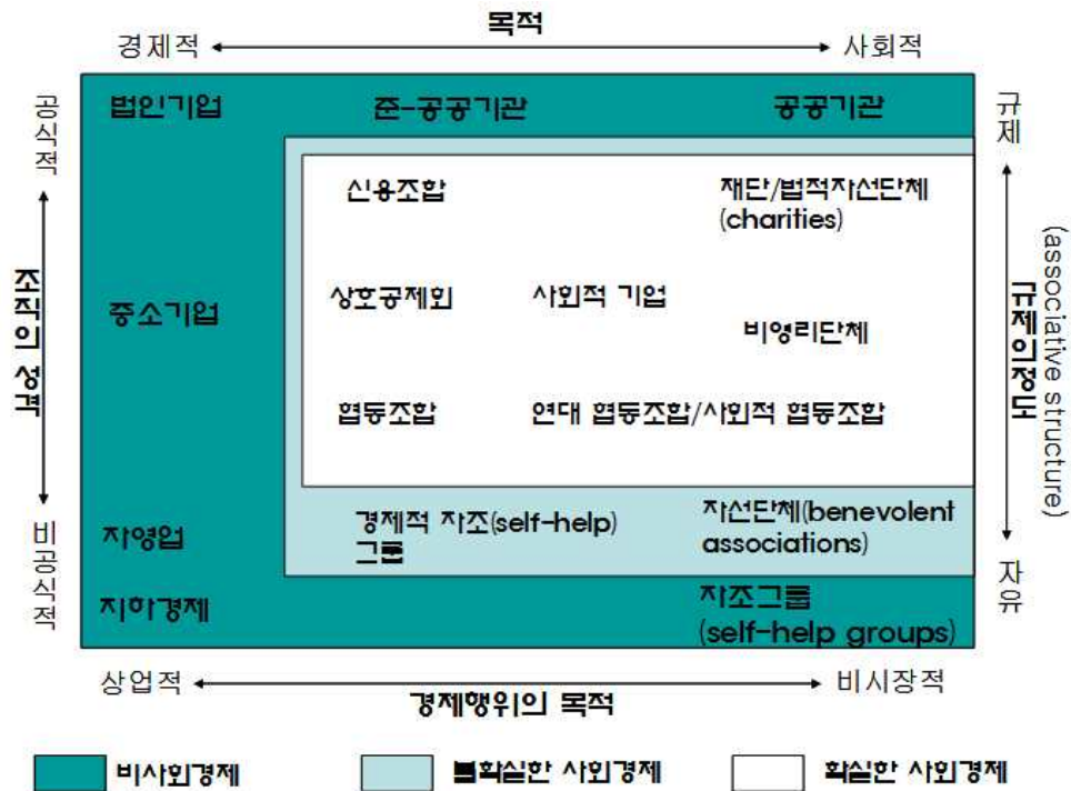
[그림 1] 사회적경제의 구성

원배분을 목적으로 하며, 시민사회 혹은 지역사회의 이해당사자들이 그들의 다양한 생활세계의 필요들을 충족하기 위해서 실천하는 자발적이고 호혜적인 참여경제(participatory economy)방식