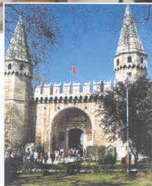
▶ 톱카프궁전의 "예절의 문" 서울 어린이대공원은 이곳 궁전문을 모델로 하였다고 한다.