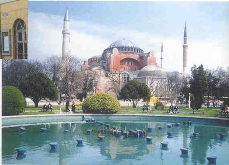
▲ 소피아 사원 전경

터키는 OECD, NATO유럽회의, 유럽의회회원국, EU의 준회원국이기 때문에 아시아가 아닌 유럽국가로 잘못 인식되고 있다. 터키사람들은 자신들이 유럽인이라고 생각할지 모르지만 유럽인들은 터키가 유럽이라고 생각하지 않는다고 한다. 터키는 국토의 95%가 아시아에 있고, 나머지 5%가 그리스와 인접하여 유럽대륙(발칸반도)