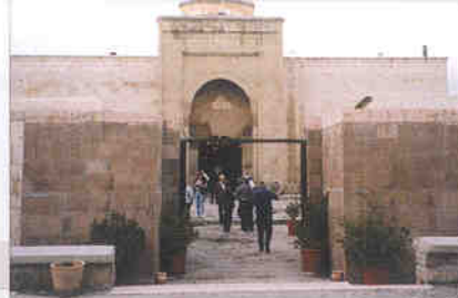
▲ 대상들의 숙소를 개조하여 만든 레스토랑

또한 헤라폴리스와 에페스의 고대도시에 남아있는 유적 자원을 활용하여 지역경제의 활성화와 경쟁력을 확보하는 장소마케팅 정책을 엿볼 수 있었다. 따라서 풍부한 역사, 문화자원과 수려한 자연경관 등 마케팅자원을 활용하여 지역주민의 삶의 질 향상과 연결된 문화상품을 추