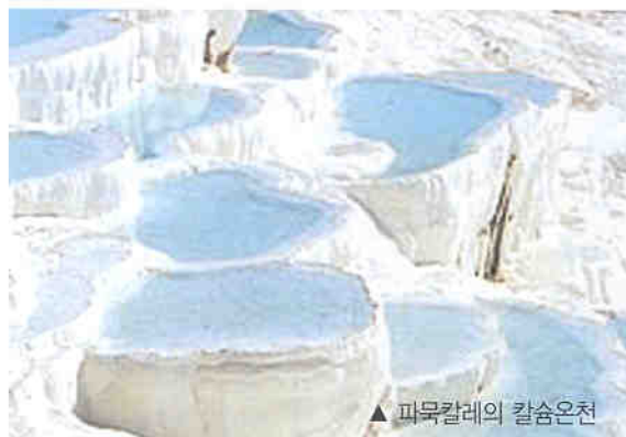
▲ 파묵칼레의 칼슘온천

이 온천 주위에 로마인 들이 건설했다는 히에라폴리스 고대도시의 원형경기장, 아폴로신전, 석관으로 가득찬 노천 공동목욕지가 오랜 세월이 흘렀음에도 원형을 유지하고 있었다. 이곳을 거쳐 기원전 이오니아문명을 발달시킨 이즈밀에 도착하였다. 해안지역으로 가는 도중에 제 주도로 착각할 만큼 많은 감귤나무밭이 이어져 있었다.