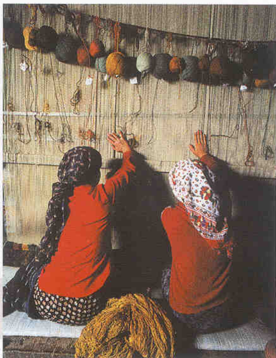
▶ 카페트를 짜고 있는 모습

어 방문하여 카페트 제조과정을 살펴볼 기회를 가졌다. 디자인 양식에 따라 꽃무늬 양식과 기하학적 양식이 있는데, 터키에서는 기하학적 무늬가 더 많이 사용되었지만 두 가지 양식이 모두 애용되었으며, 끝없이 연결되는 매듭 모양의 기하학적 무늬는 지혜와 불멸을 의미한다고 한다. 염색 비법도 조상 대대로 물려받아 천연 염료를 사용하며, 사프란 꽃에서는 노란색, 오디나무에서 연두색, 인디고 나무에서는 푸른색, 털 익은 밤이나 도토리 껍질에서 밤색의 염료를 얻는데 밤색의 염료는 대부분 세월이 흐르면 색 바랜 듯한 느낌을 준다. 카페트의 꽃은 실크 카페트이다. 실크 카페트는 보는 방향에 따라 색이 달라져 신비한 느낌을 줄 뿐 아니라, 마치 베를에서 모시를 짜듯이 가는 실로 짜기 때문에 패턴디자인도 상당히 정교하다는 느낌이 들었다. 실크 카페트는 짜는 데 1년6개월 정도의 시간이 걸리고 보통 작은 것 한 장에 1000$~25,000$정도로 가격 또한 비싼 편이다. 따라서 실크 카페트는 전통적으로 성스러운 곳이나 궁전을 장식하는 데