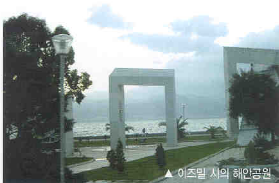
▲ 이즈밀 시의 해안공원

이즈밀을 끝으로 지방여행을 마치고 앙카라로 다시 돌아와 전시회를 마치게 되었다.