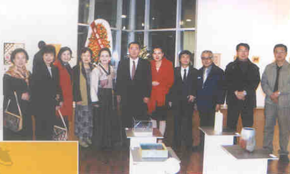
▲ 협회일행과 한국대사부부의 기념촬영