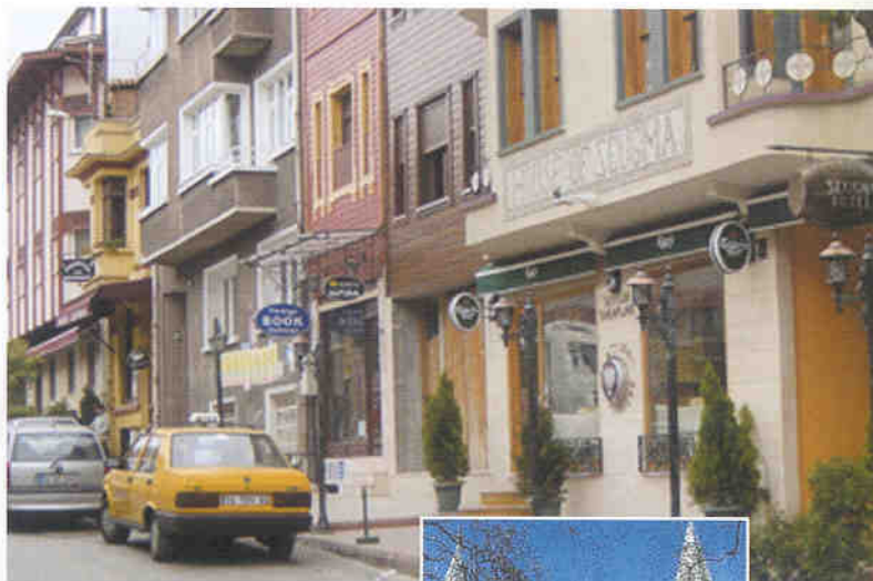
▲ 이스탄불 거리상가 안내 사인물 사인은 건물을 가리지 않고 건물 개성을 그대로 살려주고 있다.

의 유물이 전시되어 있어 이 궁전에 있는 보물을 다 팔면 부채에 허덕이는 터키의 빚을 다 갚을 수 있다고 한다. 보석전시관에는 86캐럿짜리 다이아몬드가 전시되어 있어 눈부신 광채가 보석의 진가를 발해 관광객들의 눈을 사로잡고 있었다. 궁전 별실에 전시되어 있는 아름다운 문양의 코란과, 모세의 지팡이, 그리고 이슬람교의 선지자 마호메트의 인장이 새겨진 유물들을 보면서 궁전을 박물관으로 꾸며 세계각지의 관광객을 유치하는 터키정부의 숨은 노력을 엿볼 수 있었다.