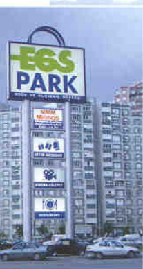
▶ 쇼핑센터 안내사인물

게 불고 해협양쪽을 연결하는 이 아름다운 해협을 가로지르는 두 개의 다리 중에 하나인 보스포러스다리는 수면에서의 다리 높이는 65m로 마치 공중에 떠있는 듯했다. 선상에서 바라보는 해협풍경이 너무나 아름답게 느껴졌다. 양쪽해협 기슭에 늘어선 터키 상류층의 주택과 별장, 그리고 프랑스 베르사이유궁전을 모방해 지었다는 화려한 돌바마체궁전, 이 건축물들이 하나의 잘 디자인된 조형물처럼 주위배경과 완벽하게 조화를 이루고 있었다. 이스탄불공항에서 오후10시 서울행 비행기에 오르니 일주일간의 피로가 한꺼번에 밀려오는듯 했다. 이번 터키 국내도시들을 일주일간 여행하고 느낀점은 첫째, 우리 한국사람들을 일등 국민으로서 대하고 있다는 것을 알 수 있었다. 터키 국민들의 소박하고, 끈끈한 정으로 인하여, 그 어느 외국에서 이곳 말고 마치 우리가 이들의 형제처럼 대접 받을 수 있는 곳이 또 있을까 하는 생각이 들었다. 6.25전쟁당시 미군 다음으로 많은 지원군을 파병하여 우리를 도왔다는 것은 역사적으로, 우리 민족의 근원지가 원래 중앙아시아였다는 사실을 되새겨 볼 때, 이는 터키 민족의 고향 역시 중앙아시아라는 사실과 관