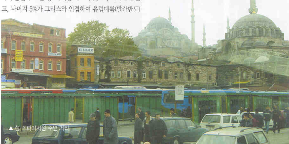
▲ 성 소피아사원 주변 거리

시차적응이 안된탓인지 새벽녘에 잠들었다가 시내에 울려 퍼지는 코란음악소리에 깨어나니 벌써 아침이었다. 일행은 제일 먼저 소피아사원을 찾았다. A.D 324년 동로마제국의 황제 콘스탄티누스가 수도를 비잔티움(현재의 이스탄불)으로 옮겨 명칭을 콘스탄티노플로 바꾼 이래로 1600년 동안 세계 역사의 중심에 있었던 도시가 바로 이스탄불이며, 동로마제국 최고의 유적이 바로 소피아사원이다.