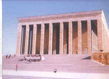
▲ 터키의 국부 아타튀르크의 묘