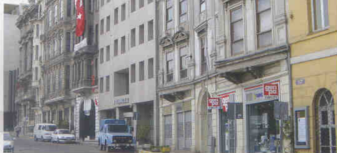
◀ 이스탄불 도심건축물

터키 한국대사관이 후원하는 한국산업미술가협회 정기 회원전이 “한국의 美”를 주제로 터키 앙카라 현대예술원에서 열리게 되어 필자는 지난해 11월 4일부터 일주일간 협회 회원들과 함께 터키를 여행하게 되었다. 토요일 오후1시에 인천공항에서 전시참가단 10여명이 인사를 나누다음 출발하게 되었다. 출발전 여행사로 부터 얻은 터키의 역사와 7천만명의 인구, 우리나라와 비슷한 기후조건, 그리고 한반도의 3.5배 넓이의 국토, 터키100만TL(리라)가 약1,200원 정도의 환율지식 등 몇가지 단편적인 정보를 들었지만 “동서양의 문명이 공존”하는 나라, 우리나라를 형제나라로 부르는 터키인과 터키역사와 문화에 대해 직접 접할 기회는 없었기 때문에 출발전 부터 기대와 호기심이 가득했다. 우리일행을 태운 비행기는 어느덧 북경을 거쳐 중앙아시아 사막을 날고 있었다. 서울을 출발한지 꼭 12시간만에 이스탄불공항에 도착하니 현지시간은 오후8시로, 우리시간보다 7시간 늦게 가고 있었다.