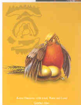
◀ 전시회에 출품한 필자의 작품 "한국의 풍수지리"