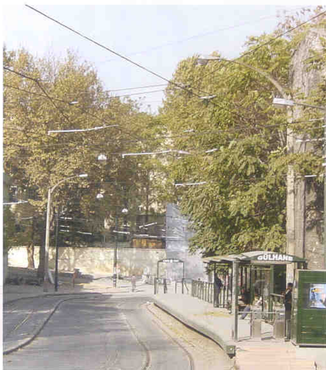
◀ 이스탄불의 전차역 버스도 이 도로를 같이 통행한다.