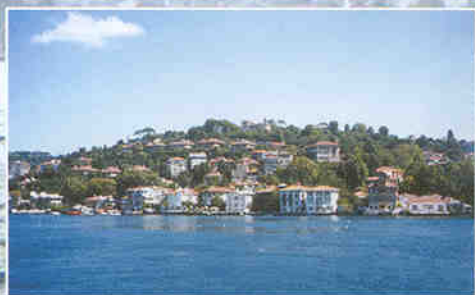
▲ 보스포러스해협의 상류층 주택과 별장