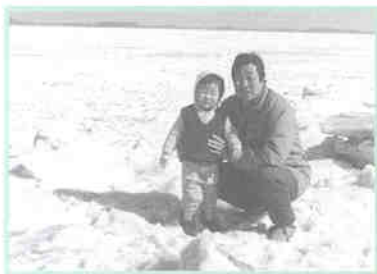
아산만 결빙 모습

또는 토정 선생이 영웅바위 주변에 지진이 일어나 바다로 변할 것을 미리 알고 한진에 머물면서 주민들에게 피신하도록 간곡하게 권하였다고 한다. 결국 함께 묵었던 소금장수만이 높은 산으로 피하였다. 그런데 소금장수는 산 중턱에서 멈추었고, 선생의 다그침에도 더 이상 올라가지 않았다. 과연 예언대로 땅이 흔들리고 바닷물이 들어오면서 마을은 모두 물에 잠겼는데, 이상하게도 소금장수가 있는 곳까지 와서는 멈추었다. 그 곳이 한진나루이고, 영웅바위는 바다 가운데 홀로 우뚝 솟은 형상으로 남게 되었다. 이 광경을 지켜 본 선생은 소금장수의 안목에 탄식을 금치 못했다고 전한다.