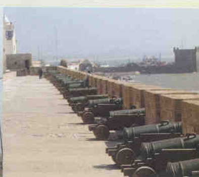
▲ 옛사위라의 해안포대