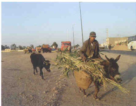
▲ 당나귀타고 가는 농부

km 2 에 이를 정도로 확장된데다 인구밀도가 낮고 반사막이 많아 대규모 송전을 하기에는 불리하다. 그래서 그들이 주력하는 에너지 공급체계는 태양열, 풍력, 소수력, 가축분뇨를 이용한 바이오메스 등의 대체에너지인데 2002년에 점유율 0.24%에서 2020년까지 19%로 끌어올리기 위한 정책을 펴고 있다. 특히 태양열은 에너지밀도가 5kWh/m 2 ·J로 높고 일조시간도 연간 3,000시간으로 우리나라의 1,827(울릉)~2,731(부여)시간보다 높다. 풍력에너지 발전현장을 보기 위해 대서양안에 위치한 옛사