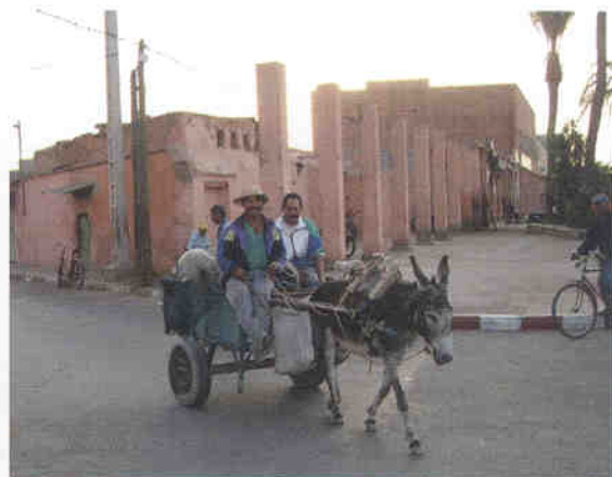
▲ 당나귀는 붉은도시 마라케쉬의 주요 운송수단