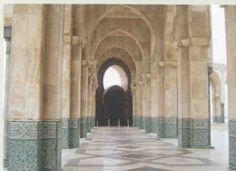
▲ 하산2세 회교사원의 건축양식

바트를 거쳐 학회장소인 마라케쉬로 갈 수 있었다. 스페인어로 하얀 집을 의미하는 카사블랑카는 포르투갈인이 처음 개척했을 때는 카사비앙코였다가 개칭된 것이라 한다. 이름 그대로 도시의 색깔은 건물들이 온통 하얀색이다. 헐리웃의 세트장에서 촬영되었지만 험프리 보가트와 잉그리드 버그만이 출연한 같은 이름의 영화 때문에도