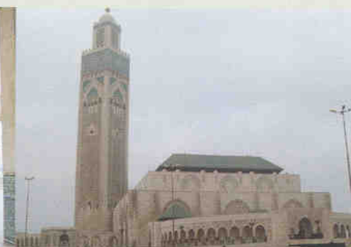
▲ 카사블랑카 대서양안의 하산2세 모스크는 사우디아라비아 메카사원 다음으로 큰 규모이다