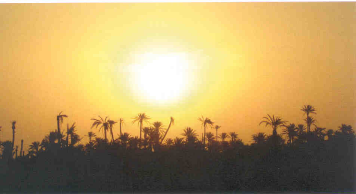
◀ 사막의 일출

우리에게 익숙하다. 밤늦게 공항에 도착하여 시차때문에 일찍 일어나 대서양에 접한 회교사원인 하산2세 모스케를 둘러보게 되었다. 이 사원은 1990년대 초에 준공되었는데 사우디아라비아의 메카사원 다음으로 규모가 크다. 사원의 주탑(minaret)은 높이가 200m에 이르는 큰 규모로 시내의 웬만한 곳에서는 다 보이기 때문에 길을 모르더라도 찾아갈 수 있다.