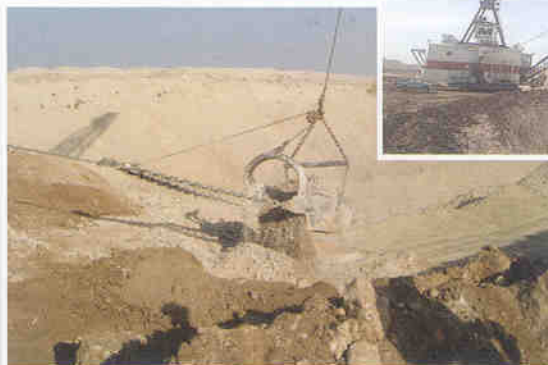
▲ 벵게리르의 인광석 노천채굴현장. 모로코는 세계최대의 인광석 및 인산 생산국이다.