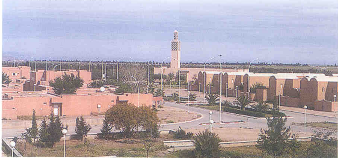
▼ 뱅게리르 인광석 광산주변의 마을공동체

장을 방문했다. 인광석은 중생대 해조류가 축적되어 퇴적변성암으로 형성된 것인데 채굴현장은 지질층상구조를 잘 보여주고 있었다. 이 지역은 간투르 광산이라하여 동서로 125km, 남북으로 20km에 이르는 지역으로 광상면적 2,500km 2 에 추정매장량은 310억m 3 에 이른다. 모로코는 연간 인광석을 2,500만톤, 인산은 300만톤을 생산하여 전세계시장의 75%를 점할 정도로 최대 생산국이다. 뱅게리르의 OCP 인광석 채굴은 1980년에 시작되었고, 그 규모가 어마어마한데 노천채굴방식을 쓰기 때문에 마치 골재채취장처럼 느껴진다. 뱅게리르 현장은 전 생산관리시스템(TPM)을 도입하여 2002년에는 일본계 획관리연구소(JIPM)가 수여하는 1등급우수상을 받았다. 역시 산업 필수원료인 인광석과 인산을 확보하기 위한