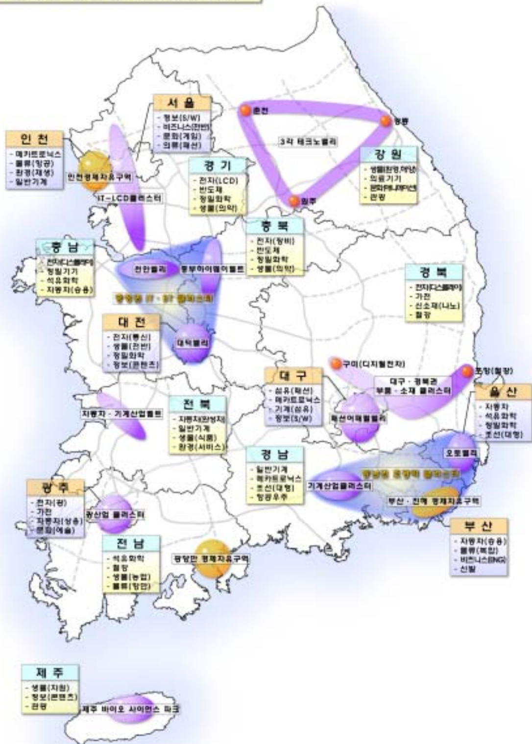
[그림 3] 권역별 산업클러스터 구축도