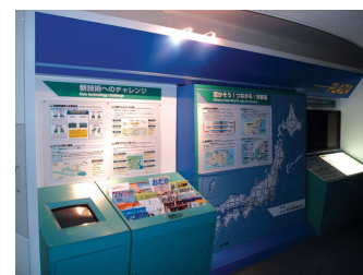
J 빌리지 홍보데스크

은 연간평균50%(전년도 45%)로 증가하였다. 또한 여름방학기간을 중심으로 지역여관조합의 숙박알선수가 1만 4,000건(전년도 1만 2,830건)으로 증가하였다.