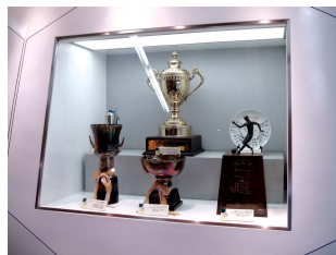
J빌리지 트로피 전시

현재 J 빌리지는 동경전력과 일본 축구협회, 후쿠시마현이 각각 전체 주식 중 10%씩의 지분을 가지고 운영되고 있으며, 그 이외의 지분은 후쿠시마현 내의 민간 회사들이나 각 시·정·촌에서 소액출자한 것이다.