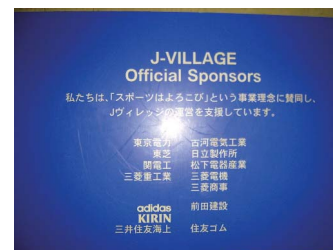
J 빌리지의 각종 스폰서

각각의 항목에서 천엔 미만은 버리고 표시