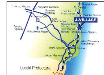
J 빌리지의 위치

이에 더하여 축구 대표선수들이 훈련할 수 있는 최고의 시설을 전국 각지에 조성하여 일본의 축구 수준을 격상시키려는 축구협회의 장기 계획이 J 빌리지 조성의 주요한 배경이 되었다.