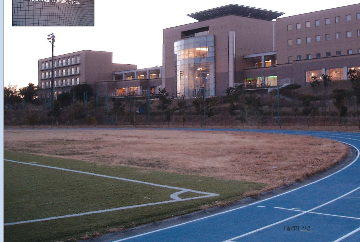
J 빌리지 전경