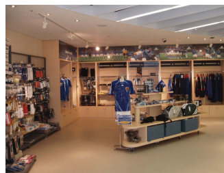
J빌리지 상품 판매관