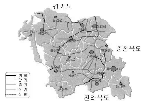
그림 1. 일반도로확충 계획도

지역간선도로망의 이용효율 극대화 및 교통 취약 지역에 대한 접근성 제고를 위하여 국도 13개 노선, 국가지원지방도 5개 노선, 일반지방도 36개 노선에 대하여 노선 연장 및 확 포장사업 추진하고 공주, 보령, 아산, 천안, 서산, 논산 등의 시급도시 및 주요 읍 면급 도시들의 도시교통 체증해소를 위하여 20개 구간의 국도 대체 우회도로를 개설하고 서해안관광산업도로 건설과 연계하여 [보령~안면도] 및 [서산-대산~태안 이원]간 연육교를 가설하고, 금강변산업관광도로 등의 조기 건설로 산업 관광부문의 활성화를 촉진하는 것이다.