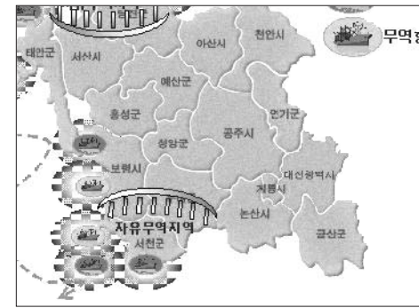
그림 3. 항만배치 구상도

당진 대산항, 장군신항 등의 배후지역에 산업단지 개발 및 자유무역지대 지정하여 수도권항의 1차 보완기능을 수행하는 중국과의 산업교역 중심항으로 개발하고, 자유무역지대로 지정하여 지역경제의 거점화를 만들고, 항만은 수송 물류 정보망을 갖춘 제3세대형 종합물류기지로 개발하며, 항만과 배후지역간의 철도, 고속도로 등의 연계수송망 구축 및 컨테이너기지, 종합물류단지 등을 건설하는 것이다.