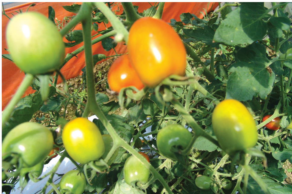
네델란드산 방울토마토 시험재배지

그리고 2007년 한·미 FTA가 협정되어 기준을 남겨두고 있는 상황임에도, 아직 본격적인 교역도 시작하기 전에 축산 가격은 계속 내려가고 있다. 참으로 어려운 상황에