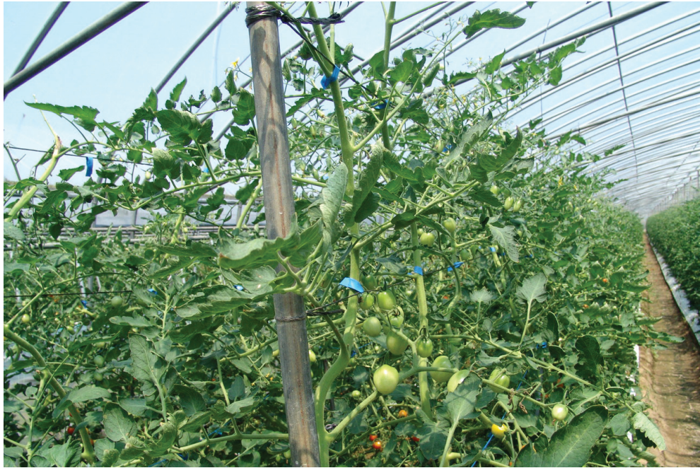
GAP 방울토마토 생산 농가

처한 우리 농업을 지원하기 위한 각종 정책이 발표되고 있지만 농민은 체감하기 어렵다. 친환경 농업 또한 상황은 마찬가지이다. 특히 친환경 쌀은 급격히 늘어나는 생산량에 비해 소비는 증가되지 않아 일부 농협에서는 2005년도 생산분도 창고에 보관하다 낮은 가격으로 시중에 내놓고 있는 것이 현실이다. 들판에는 2007년도 수확하게 될 친환경 벼들이 쑥쑥 자라고 있다. 벼가 익어가고 있는 것이다. 벼 스스로 무르익어 고개를 점점 숙이고 있다. 마치 절망에 처해