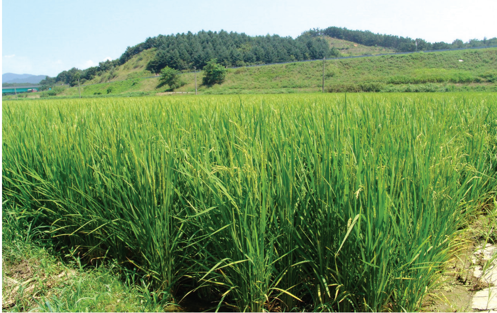
친환경 벼 재배지