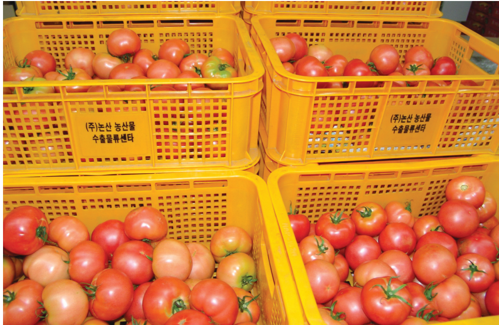
토마토 입고 제품

이 회사의 장점은 생산농가가 전국적으로 분포하여 사계절 신선한 농산물을 소비자에게 공급할 수 있으며, 충남대 생명공학과 교수의 자문을 받아 자체 주문한 CA저장 창고는 완전 밀폐 차단 장치를 한 6칸의 CA저장 창고에 약 50톤의 농산물을 저장하여 공급 물량을 저장하여 시중 가격의 변동 없이 안정된 가격을 만들어 낼 수 있다. 이는 회사의 운영에 커다란 힘이 될 뿐 아니라 농가 소득에도 한 몫을 하고 있다. 또한 농산물은 신선도에 영향을 많이 받는다. 따