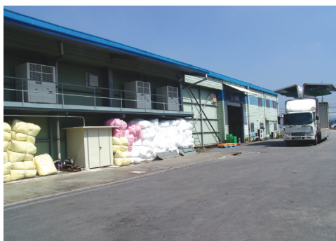
컨테이너 출하시설 및 저온저장 시설

역을 벗어나지 못하고 있음을 볼 때, 이 같은 시도는 이 회사의 특유의 장점으로 볼 수 있다. 또한 수출에 있어서도 미국, 대만, 일본, 홍콩, 뉴질랜드 등 특정 국가를 대상으로 하는 것이 아니라 다원화되어 있다는 점이 강점으로 보인다.