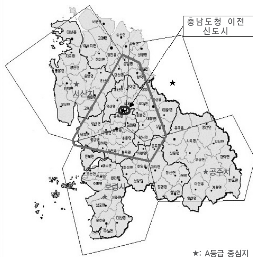
〈그림 1〉 도청이전 신도시 중심지의 시장영역

신도시의 계획규모는 인구 10만 명이지만 도시의 영향권을 고려하면 기능적, 물리적으로 도입되어야 할 도시기능의 수준은 25만명 정도의 계획이 필요하다고 할 수 있다.