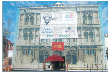
〈그림 8〉 사진촬영을 하여 건물 보수시 참조