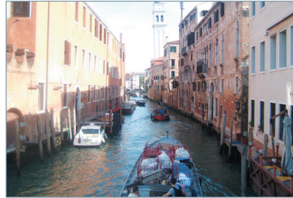
〈그림 7〉 광장 및 수로