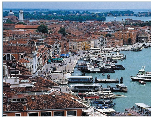
〈그림 4〉 유기적 도시 베네치아

베네치아의 도시성장을 살펴보면 인위적인 도시계획을 통한 도시가 아니라 바다와 운하라는 자연환경과 긴밀하게 연계하면서 성장과 변화를 반복한 도시다. 이에 특이한 공간구조를 가지고 있으며, 미로와 같은 유기적 도시의 특성을 가지고 있다. 계획된 도시가 연출하는 직선적인 조망