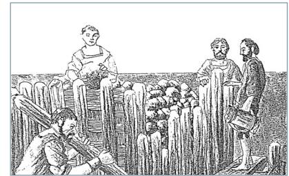
〈그림 5〉 인공지반을 만들기 위한 기초 작업