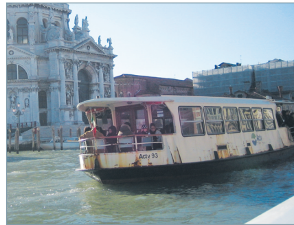
〈그림 6〉 곤돌라와 수중택시