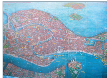
〈그림3〉 베니스 지도