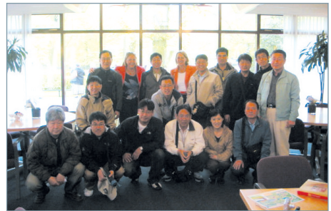
〈그림 1〉 연수자 단체사진

본 해외출장의 목적은 선진외국의 우수제도 및 정책추진현황을 파악하고, 지역개발 성공사례를 통해 지역개발의 종합적인 정책방향을 마련하고자 하는 것이다. 9박 11일의 일정으로 이탈리아, 스위스, 프랑스, 독일, 네덜란드 등 유럽 5개국을 다녀왔으며, 그 중 역사적·문화적 유산을 보전하여 관광산업 활성화에 성공한 이탈리아 베네치아 지역을 살펴보고자 한다.