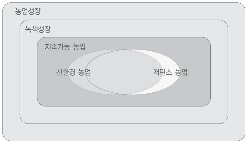
〈그림 2〉 농업부문 녹색성장의 개념적 위치

농업부문에 녹색성장을 지향하는 농업을 그린농업(green agriculture)으로 규정할 수 있으나 공식적으로 널리 이용되는 용어는 아니다. 농업부문에서 녹색과 연계하여 여러 가지 용어가 사용되고 있으나 녹색성장과 직접적으로 관련된 것이 아님에 유의할 필요가 있다. 예를 들면 중국에서는 친환경의 의미를 소비자들에게 보다 다가가는 의미로 ‘녹색식품(green food)’이라는 용어를 사용하고 있다. 또한 농업분야에서 다수확 품종개발(통일벼 계통의 신품종 IR667)을 통한 획기적인 생산성 증대를 “녹색혁명(green revolution)”이란 용어를 사용하고 있고, 겨울철 유희농지에 사료작물을 재배하는 경우 “제2의 녹색혁명”이란 용어로 사용하고 있으나 녹색성장과 직접적으로 관련되어 있다고 볼 수는 없다.