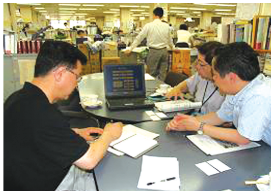
〈그림 3〉 가나자와 시청 도시정비국 브리핑