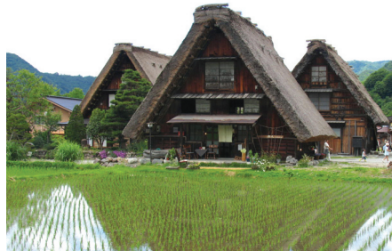
〈그림 23〉 시라카와고 마을