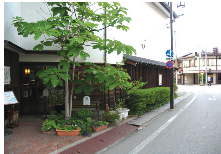
〈그림 16〉 인도와 차도의 턱 제거