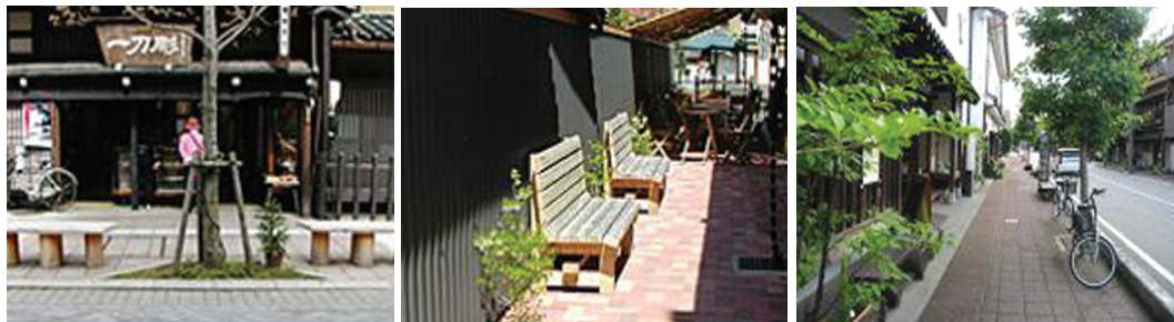
〈그림 19〉 길거리 벤치 설치