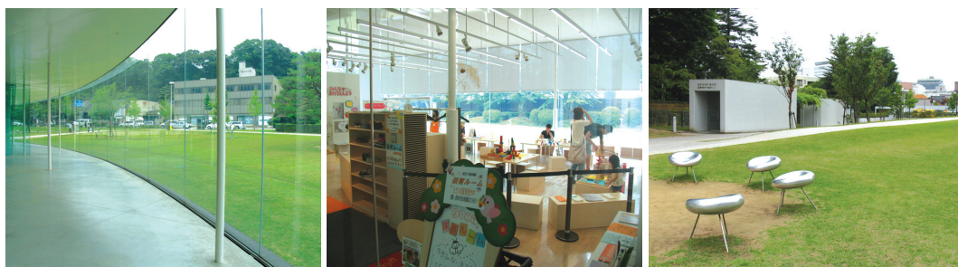
〈그림 13〉 가나자와 21세기 미술관