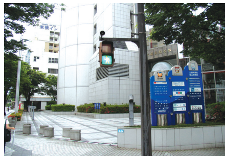
〈그림 12〉 가나자와 시내 음성정보 신호등