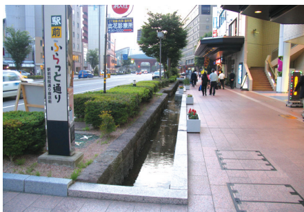
〈그림 8〉 가나자와 시내 수로조성