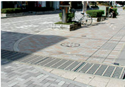
〈그림 15〉 보행자를 위한 안전한 트랜치 시설

다카야마시에서는 외국인 관광객들의 편리성을 높이고 또 사람과 사람, 사람과 지역이 서로 교류하고 이해할 수 있도록, 커뮤니케이션의 원활화 및 정보에서의 장벽 제거에 대한 정책을 추진하고 있다.