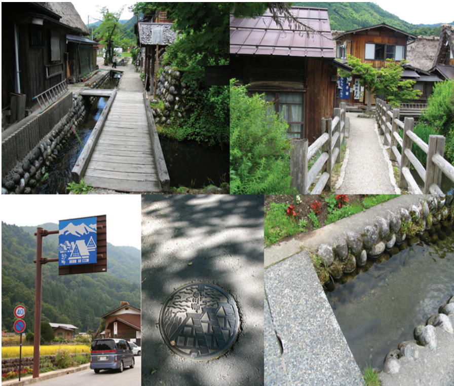
〈그림 24〉 시라카와고 안내사인, 맨홀, 마을골목길