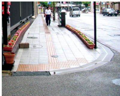
〈그림 10〉 차도와 인도의 턱이 없는 보행자 중심공간

따라서 지역공간에서 보행자 중심의 보행권 확보는 매우 중요한 공공디자인 요소라 할 수 있다.