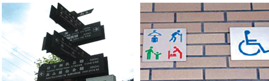
〈그림 18〉 방문객을 위한 정보서비스 픽토그램 설치