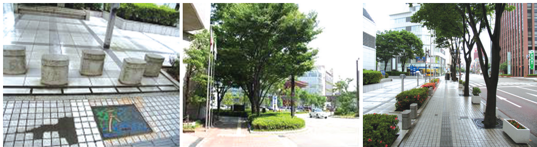
〈그림 7〉 공간, 시설물(인도, 블라드)

정책으로 가나자와 역에서 21세기미술관을 잇는 가로축을 중심으로 예술성이 넘치는 조각 작품 및 공예작품을 설치하였다. 이를 위해 가나자와 시에서는 세계 각국 에서 공모한 뛰어난 조각 작품을 설치하고, 기업의 쇼윈도우에 학생들의 작품을 전시함으로써 가로경관의 매력을 높여 지역 전체에 즐거움과 활력을 부여하였다.