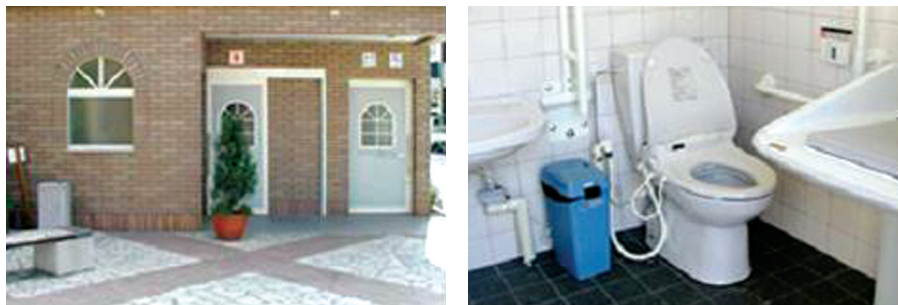
〈그림 17〉 장애인을 위한 화장실 설치