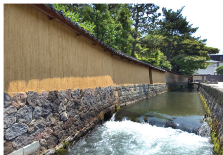
〈그림 9〉 가나자와 무사촌에 조성된 수로