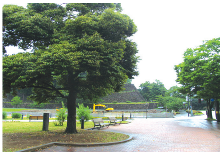
〈그림 11〉 가나자와 성주변 공원