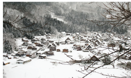
〈그림 21〉 시라카와고 전경(여름:좌, 겨울:우)