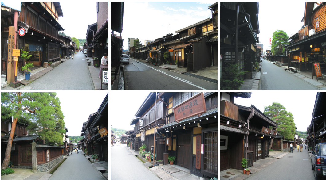
〈그림 20〉 전통건조물 보존지구