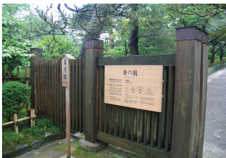
〈그림 4〉 겐로쿠엔 정원 입구