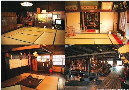
〈그림 22〉 전통가옥(갓쇼즈쿠리) 내부 모습