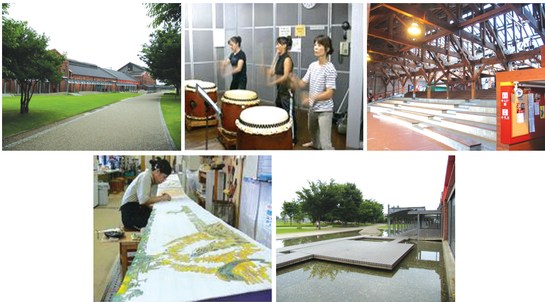
〈그림 14〉 가나자와 시민예술촌