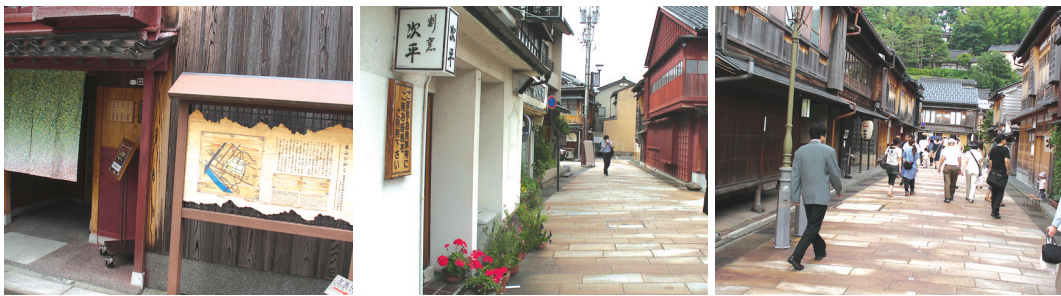
〈그림 6〉 히가시차야 도오리(東茶屋通り)지구