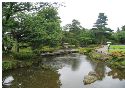
〈그림 5〉 겐로쿠엔 정원