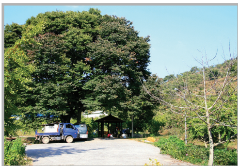
〈사진 3〉 꽃뽕마을 03