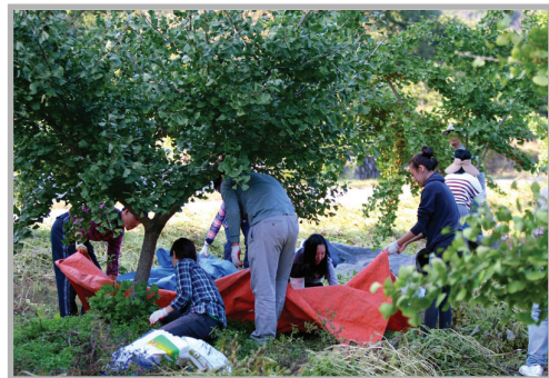
〈사진 22〉 은행털이범(?)들의 바쁜 손놀림