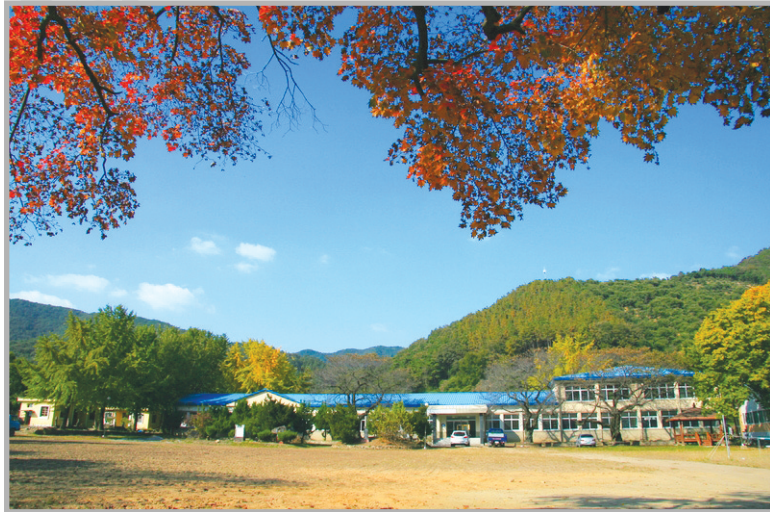
〈사진 14〉 맥문동 축제를 비롯한 각종 마을 행사가 열리는 폐교의 가을 풍경 (현재 폐교된 화산분교 건물을 활용해 각종 문화행사 장소로 활용하고 있으며, 앞으로 더욱 적극적으로 폐교 활용 계획을 수립해서 마을 홍보에 나설 계획이라고...)

시간이 허락되지 않아 직접 둘러보진 못했지만, 꽃피마을에는 정혜산(355m)을 오르는 등산로가 잘 정비되어 있어 절골마을과 정혜사, 상암 등을 거쳐 정상까지 올랐다가 내려오는 3시간 남짓의 5개의 등산코스도 경험해 볼 수 있다.