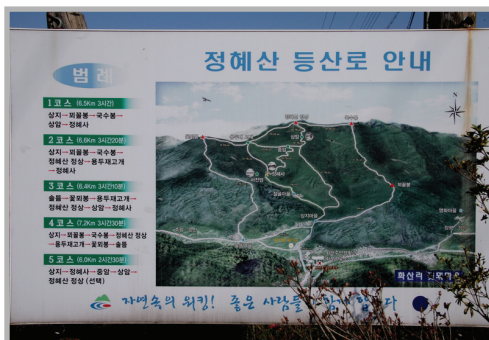
〈사진 15〉 꽃피마을에 설치된 정혜산 등산로 안내판

시간이 허락되지 않아 직접 둘러보진 못했지만, 꽃피마을에는 정혜산(355m)을 오르는 등산로가 잘 정비되어 있어 절골마을과 정혜사, 상암 등을 거쳐 정상까지 올랐다가 내려오는 3시간 남짓의 5개의 등산코스도 경험해 볼 수 있다.