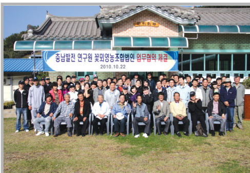
〈사진 13〉 충남발전연구원 - 꽃피영농조합법인 업무협약

이와 관련해서 꽃피마을은 ‘녹색농촌 체험프로그램’이나 ‘농특산물 판매’ 등을 목적으로 이미 2006년도에 ‘꽃피영농조합법인’을 설립하고, 타 지역(대전 동구 가양2동, 인천시 도화1동 등) 및 기관 등과 자매결연을 맺고 있었다. 그리고 우리 연구원도 2007년도에 자매결연을 맺은 후 보다 본격적인 상호 협력을 목적으로 업무협약식을 갖게 된 것이다.