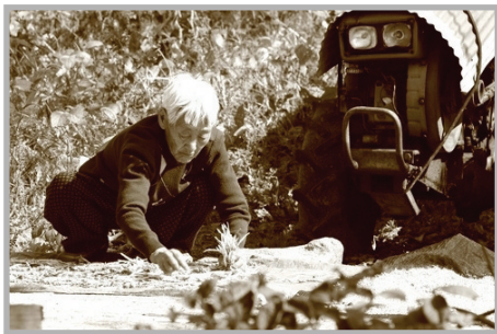
〈사진 19〉 꽃뽕마을 할머니의 모습

저녁까지 이어진 농촌봉사활동은 비록 체험행사와는 다른 의미의 일정이긴 했지만, 머리로만 알고 지냈던 농촌의 현실을 온몸으로 체험하고 조금이나마 농촌의 일손을 도와드렸다는데 그 목적은 같다고 생각한다.