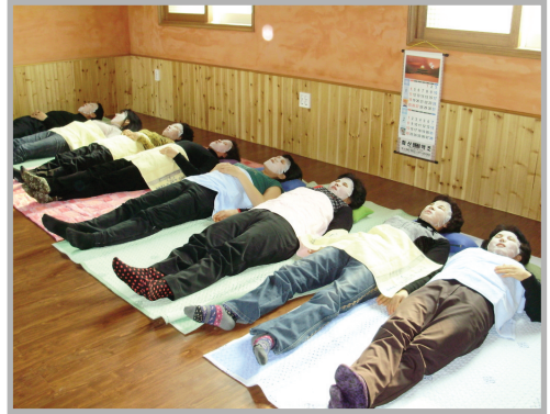
〈사진 9〉 맥문동 마스크팩 체험행사

무엇보다 4월중에 열리는 꽃뽕마을의 대표행사인 ‘맥문동 축제’는 올해 4회째를 맞았으며, 색다른 체험과 먹을거리, 놀거리들로 방문객들의 오감을 만족시키고 있었다.