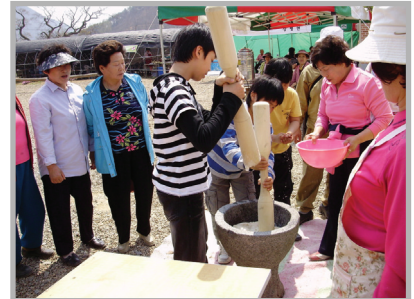
〈사진 11〉 떡메치기 체험행사

맥문동 축제의 주요 프로그램은 맥문동 수확체험, 맥문동 화분 만들기, 맥문동 마스크팩 체험, 떡메치기, 꽃사탕 만들기, 비누만들기, 투호놀이 등 체험거리와 동동주, 파전, 맥문동 차, 맥문동 떡, 도토리묵 비빔밥 등 풍