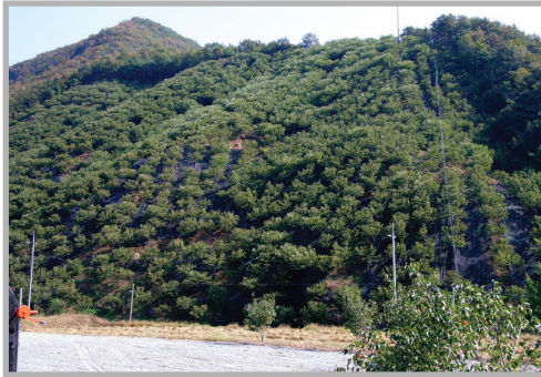
〈사진 4〉 산 전체가 밤나무 숲