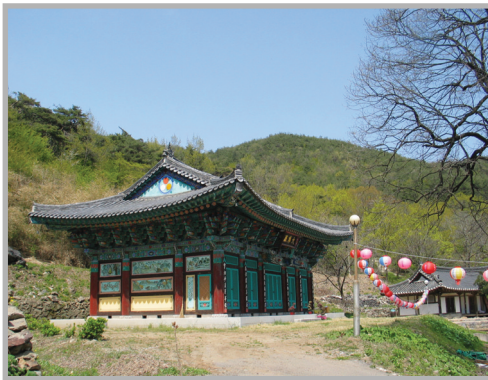
〈사진 16〉 정혜사의 모습

과 산신각, 석굴암, 중암, 서암 등 암자가 있다. 정혜사의 현판은 3·1운동의 33인 중 한 분인 오세창 선생이 직접 쓴 것이라고 한다.