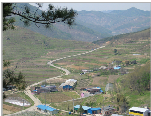
〈사진 1〉 꽃뽕마을 01

사실 청양 꽃뽕마을은 전국에서도 알아주는 ‘맥문동 축제’로 유명해진 마을로써 농촌체험관광의 기회를 알리는 좋은 계기가 될 것이란 필자의 판단이 크게 작용했다. 이것이야말로 일거양득!