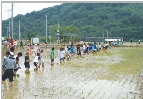
〈사진 6〉 모내기 체험행사

봄에는 모내기를, 가을에는 알밤줍기와 고추따기체험을 할 수 있고, 맥문동으로 만든 마스크 팩 체험이나 맥문동 비누만들기, 그리고 지금은 폐광이 된 마을 뒷산의 박쥐동굴체험 등 언제든지 가족단위, 단체로 경험해볼 수 있는 끼리들이 많은 곳이다. 그리고 이곳 체험관에는 민박 시설도 운영하고 있어 식사는 물론 보다 다양한 체험활동을 저렴하게 즐길 수 있도록 편의를 제공하고 있다.