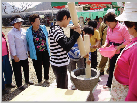
〈사진 10〉 꽃피마을 특산물인 맥문동

성한 먹거리를 즐길 수 있다. 또 2009년 자매결연을 맺은 ‘안산 브라보 윈드 오케스트라’의 연주로 도시민과 주민이 함께 어울릴 수 있는 축제의 장이 펼쳐진다.