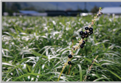
〈사진 10〉 꽃뽕마을 특산물인 맥문동 를 차지할 정도다.

무엇보다 4월중에 열리는 꽃뽕마을의 대표행사인 ‘맥문동 축제’는 올해 4회째를 맞았으며, 색다른 체험과 먹을거리, 놀거리들로 방문객들의 오감을 만족시키고 있었다.