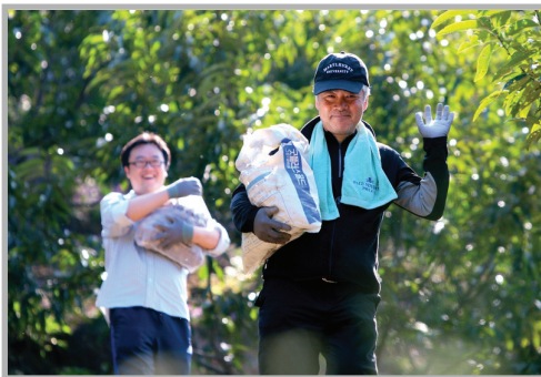
〈사진 21〉 커다란 알밤이 한아름