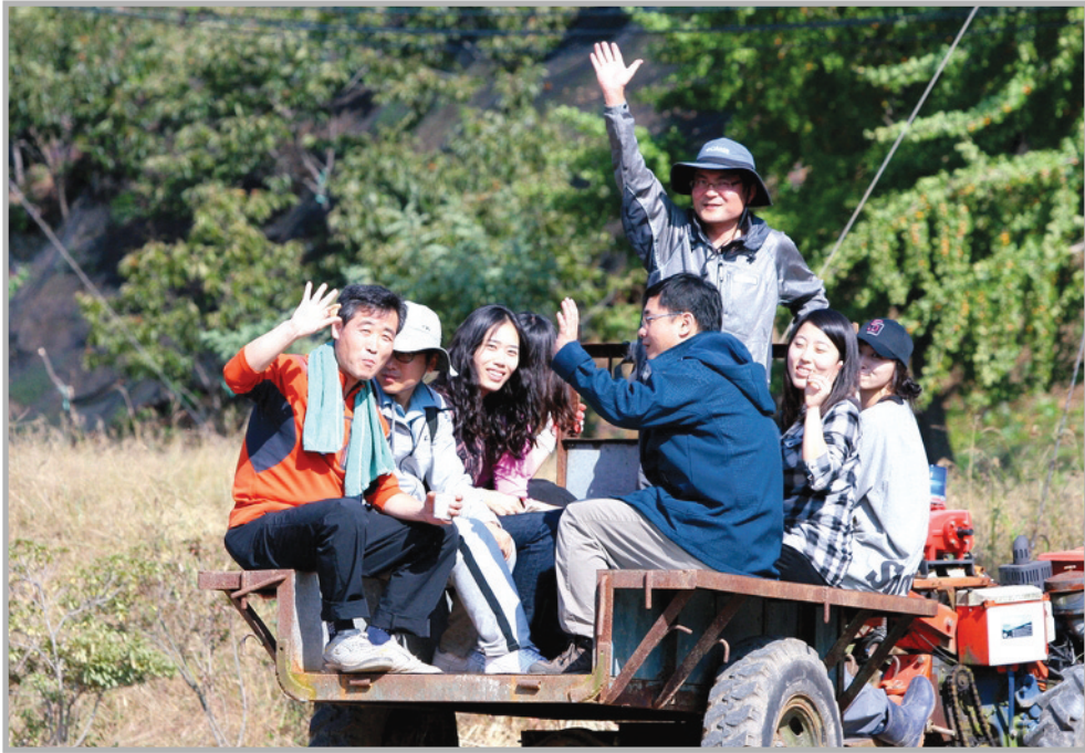
〈사진 20〉 농촌봉사활동을 위해 경운기를 타고 이동하는 모습