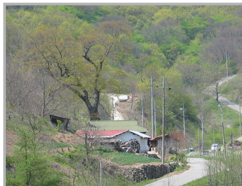
〈사진 2〉 꽃뽕마을 02