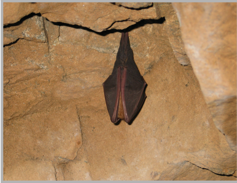
〈사진 8〉 박쥐동굴 체험행사