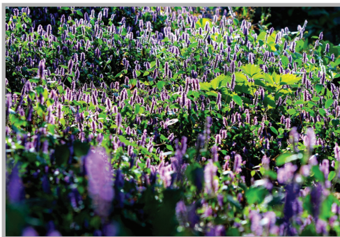
〈사진 18〉 야생화 ‘꽃향유’의 모습

가을하늘빛이 따뜻함보다 뜨겁게 느껴지는 10월의 어느 날, 꽃피마을에 도착한 필자와 연구원 일행을 반갑게 맞아주시던 마을 어르신들의 정겨운 웃음이 잊혀지질 않는다.