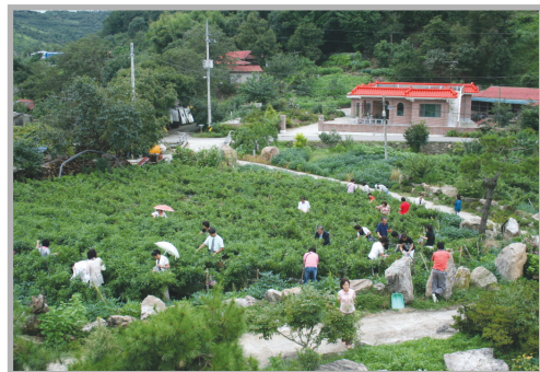
〈사진 7〉 고추따기 체험행사