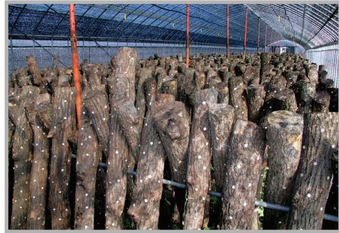
〈사진 5〉 대규모 표고버섯 재배 모습