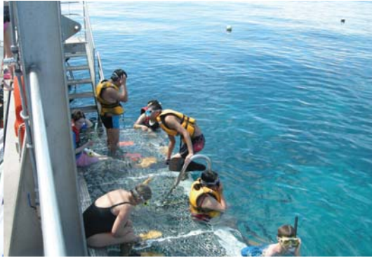
산호군락에 위치한 해양 테라스

험 등이 있다. 이들 중 대보초 크루즈와 열대우림과 쿠란다 마을을 체험하였다.