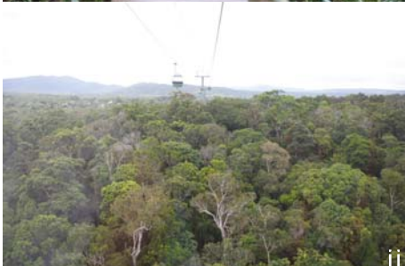
i 열대우림 내에서 설명을 하고 있는 레인저 ii 열대우림 상공을 지나가는 케이블카