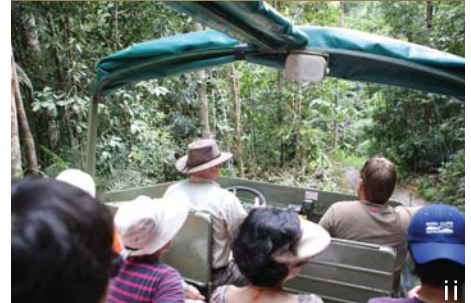
i 열대우림 내 습지를 운행하는 수륙양용차 ii 열대우림에 대해 설명하는 가이드와 탐방객