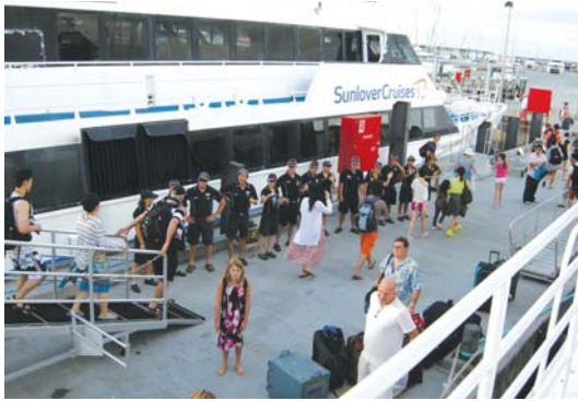
썬러버 크루즈에서 운항 중인 패속선