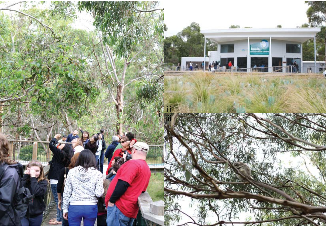
i 코알라를 관찰하는 탐방객 ii, iii 코알라 보전센터 전경과 휴식중인 코알라

펭귄 프레이드는 필립섬의 서쪽 끝지역에서 번식하는 펭귄무리들이 낮시간 동안 먹이를 먹은 후 저녁 해질녘에 해안가에 오른 후 모래사장을 건너 언덕에 파놓은 굴 속의 둥지로 돌아가는 수 백마리의 펭귄들을 가까이서 직접 관찰하는 상품으로 ‘프레이드’라는 명칭에 어울리게 끊임없이 줄지어 가는 모습을 볼 수 있다. 프레이드는 약 50분 동안 계속되며 탐방객들은 해안가에 위치한 관람석과 언덕에 자리잡은 테크 등 야외에서 펭귄들을 직접 관찰하게 된다. 방문자센터와 해변의 관람석 그리고 관찰테크, 주차장 외 시설물은 간소화 하였으며 정해진 경로 이외에는 대부분 출입을 봉쇄하고 있었다. 특히 방문자 센터 이외의 지역에서는 사진촬영이 엄격히 금지되어 있었으며 곳곳에 배치된 자원봉사자와 레인저들이 통제를 담당하고 있었다. 한때 많은 탐방객으로 인해 펭귄의 개체수가 많이 줄어든 뉴질랜드 샌드플라이(Sandfly)와는 다르게 이 지역은 ‘필립섬 자연공원 관리위원회’에 의해 서식지 관리 시스템을 통한 체계적인 관리가 이뤄지고 있었다. 위원회는 자치기관으로서 펭귄 개체군에 대한 연구활동 뿐 만 아니라 교육 및 보호활동도 실시하고 있었다. 입장료와 기념품 판매를 통한 수익금은 필립섬 야생동물의 보전에 이용된다고 한다.