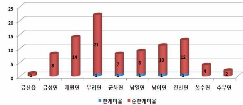
<그림-1> 금산군 읍면별 한계마을 및 준한계마을 현황