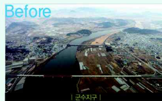
| 군수지구 |

지역주민들의 여가생활 및 건강증진에 도움이되며, 다양한 역사와 문화를 체험할 수 있는 복합문화공간을 창조합니다.