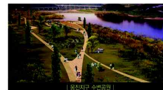
| 용진지구 수변공원 |