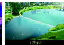
| 금남보 |