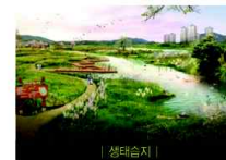
| 생태습지 |