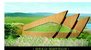
| 와초지구 철새조망시설 |