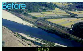
Before | 볼내공원

가뭄 및 홍수방지기능과 함께 아름다운 관광자원이 되는 다기능보를 설치하고 다양한 운동공간 제공 및 생태공원을 조성합니다.