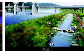
| 어도 |