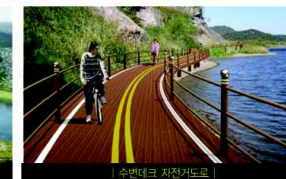
| 수변데크 자전거도로 |