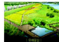
| 유채물길 |