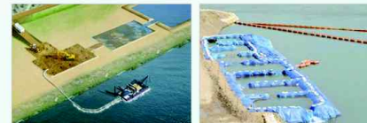
▶ 수중준설 계획도