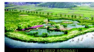
| 신성리 • 시음지구 수질정화습지 |