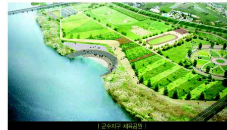
| 군수지구 제방공원 |