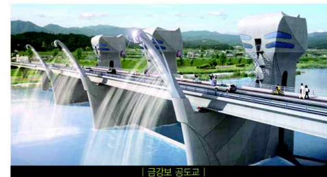
| 금강보 공도교 |