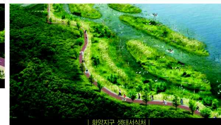
| 화양지구 생태서식처 |