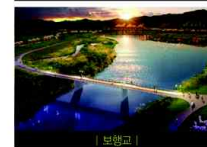
| 보행교 |