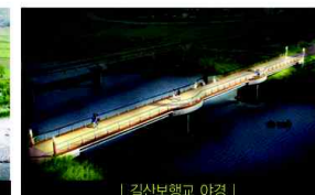
| 갈산보행교 야경 |