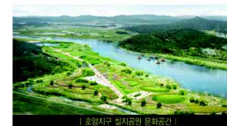
| 호암지구 칠지공원 문화공간 |