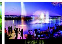
| 수심문화공원 |