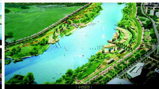
| 수변공원 |