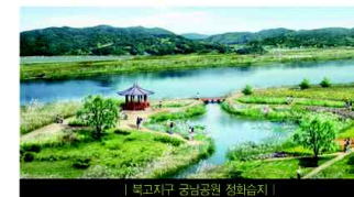
| 복고지구 금남공원 정화습지 |