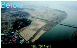
| 와초, 양화지구 |