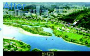
After | 볼내공원