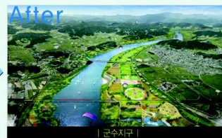
| 군수지구 |