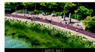
| 자전거 쉼터 |