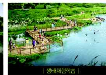
| 생태체험학습 |