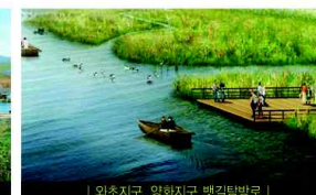
| 와초지구, 양화지구 뱃길탐방로 |