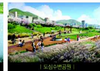
| 도심수변공원 |