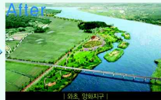
| 와초, 양화지구 |