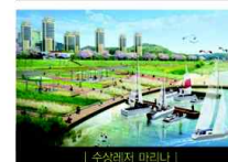
| 수상레저 마라나 |