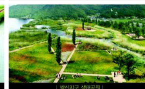
| 생신지구 생태공원 |