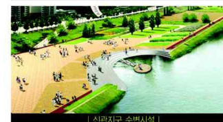
| 신관지구 수변시설 |