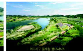
| 외리지구 물새생 생태사육지 |