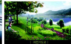
| 자전거도로 |