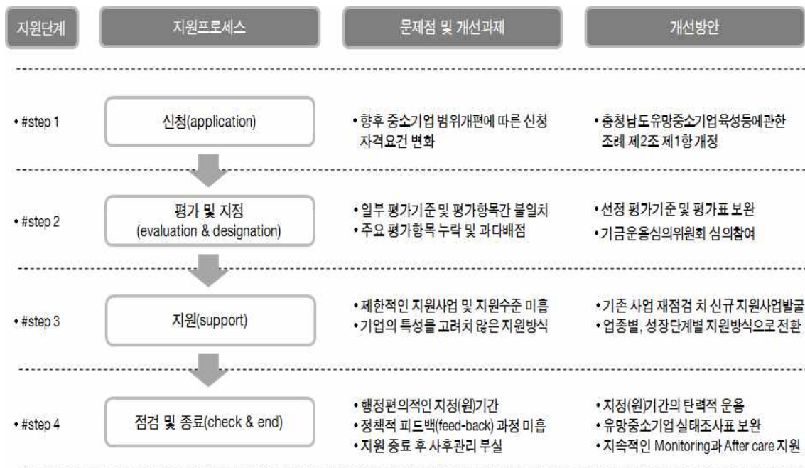
[그림 2] 유망 중소기업제도의 운영개선방안