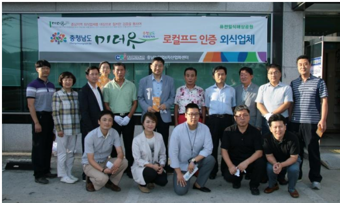
미더유 인증식당 제등식(공주시 해상공원)