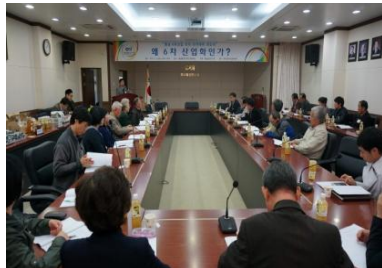
좌: 6차산업 리더 아카데미 개강식(2013.4) 우: 6차산업 리더 아카데미 발표(2013.11)