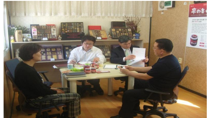
현장 방문 컨설팅