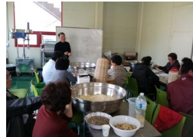
좌: 전통주 아카데미 실습(2013.3) 우: 전통주 아카데미 품평회(2013.12)