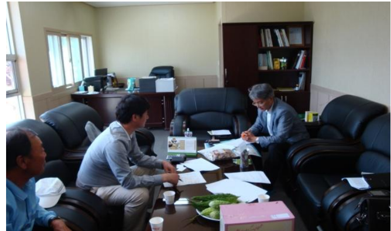
6차산업화 경영체 모니터링 모습