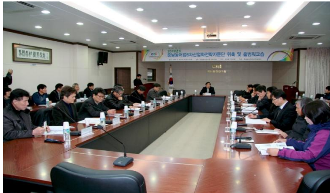
6차산업화전략자문단 출범(2013. 2)