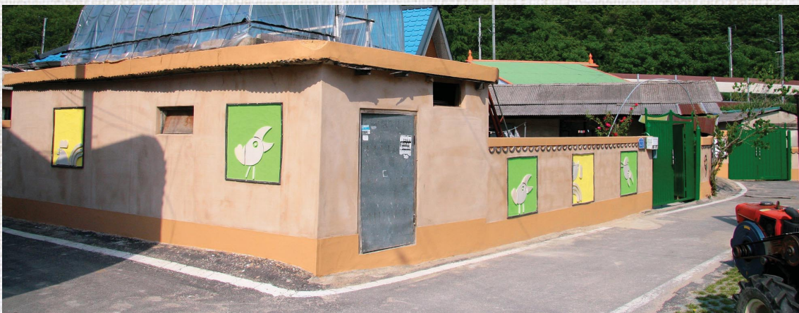
〈대부분의 마을 담벼락엔 이렇게 다양한 그림이 그려져 있다〉