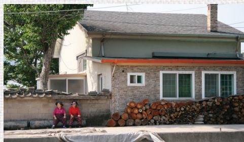
〈그늘에서 잠시 쉬고 계신 마을주민〉