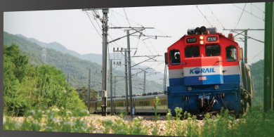
마을 바로 옆으로 호남선이 지나간다