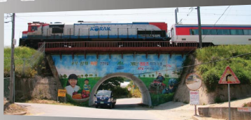
마을 들어가는 입구의 모습

송무선 위원장이구요. 아~ 여자분이세요. ^^ 이 마을 토박이시고 어느 누구보다 마을에 애착이 많으시고 추진력도 정말 좋아요. 2010년도에 본격적으로 마을사업을 시작하시더니 그 뒤에 저를 데리고 오셨죠! 이곳 정보화마을 건물도 위원장님이 버섯농사 지었던 부지에 공짜로 사용하게 해서 지은 거랍니다. 부족한 게 많은데 많은 일들을 위임해주셔서 어찌다보니 제가 위원장님을 '배후조정' (?)하는 것처럼 보일수도 있는데, 실상은 그렇지 않아요!(하하하)