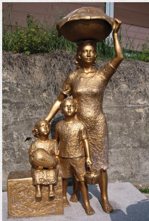
〈마을 뒤편에 자리잡은 동상〉