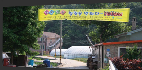
마을에 붙은 체험행사 현수막

이곳이 고향인 위원장님과는 달리 저는 이번 세월호 참사가 일어난 진도가 고향이에요. 팽목항이 눈감고도 그려지니까 더 가슴이 아팠어요. 지금은 이 마을이 저의 제2의 고향이 되었죠. 마을에 민집이 생기면 들어와 살고 싶은 생각이랍니다.