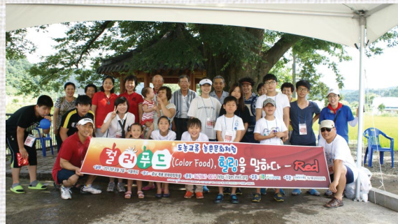
〈색깔있는 다양한 체험프로그램들〉