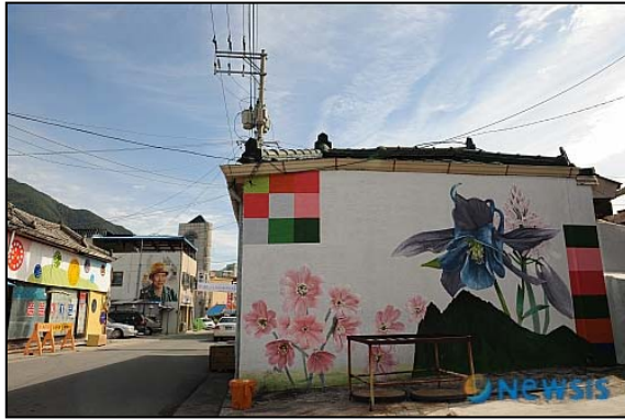
노후주택과 연계한 공공미술(영월)