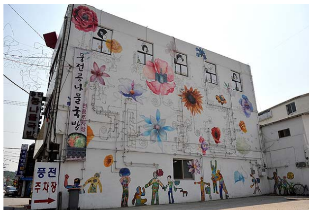
사회적 기업(사)전통문화사랑의 공공디자인 활동