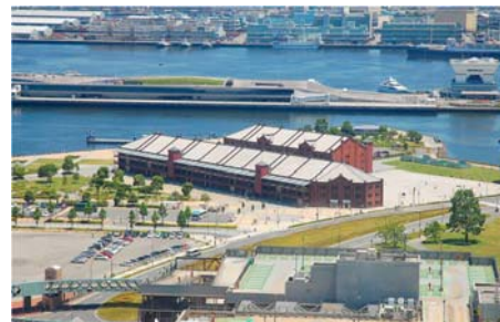
옛 하역창고를 쇼핑몰로 조성 (요코하마 아카레가소코(赤レンガ倉庫))