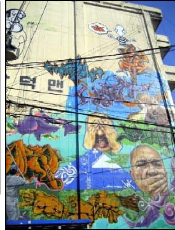
빈 맨션을 활용한 공공미술(대구)