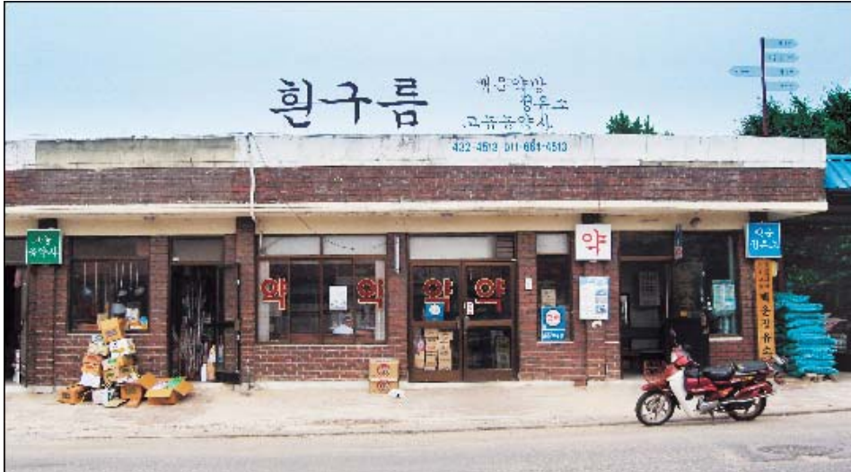
이야기가 있는 간판디자인(진안군 백운면 원촌마을)