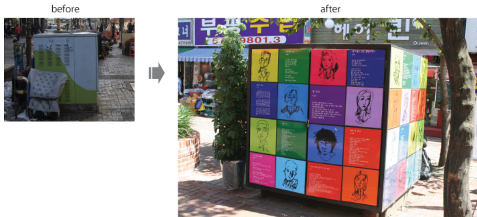
부평 전통시장 공간디자인 개선사업