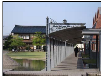
옛 방적공장을 활용한 시미예술촌 조성(가나자와)