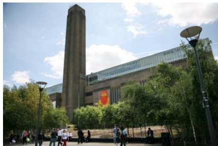
옛 발전소를 현대미술관 조성 (영국 런던 테이트모던 갤러리)