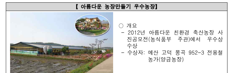
【표 5】 선진 축산의 우수사례