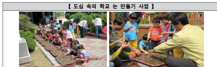
【표 4】 친환경 고품질 농업의 우수사례