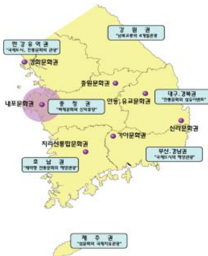
< 7대 문화·관광권과 지역문화권(예시) >