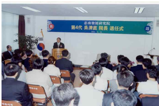
제4대 원장 퇴임식