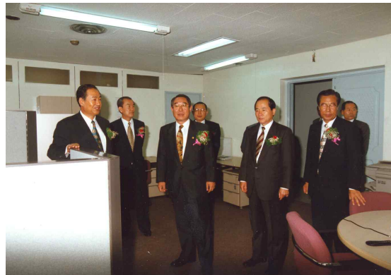
연구실을 방문한 내빈