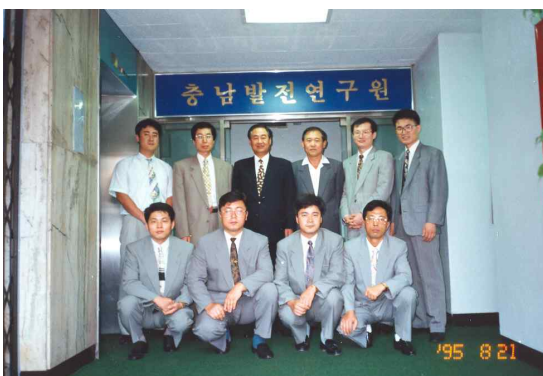
초창기 연구원 직원