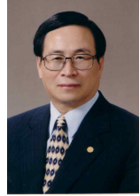
오 세 직 (제4대 원장/충청남도교육감)

우선 충남의 새로운 미래를 창조하는 충남발전연구원이 쌓아온 10년의 성장에 대해 진심으로 축하드리는 바입니다.