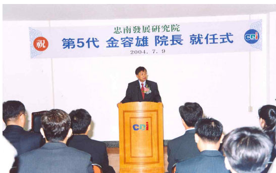
제5대 원장 취임식