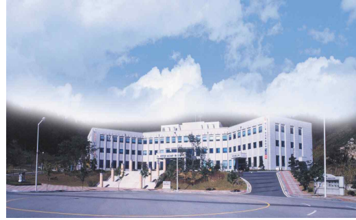
계룡시청 (2차 이전청사)