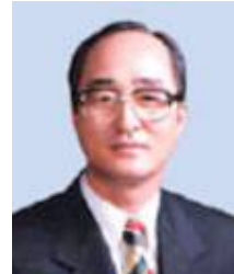
심 대 평 (충청남도지사, 충남발전연구원 이사장)