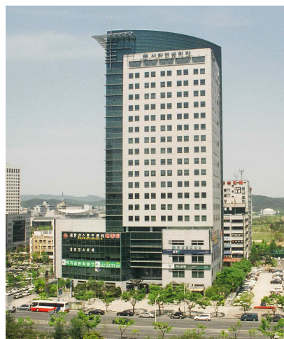
사학연금회관 (1차 이전청사)