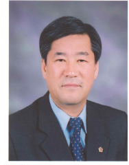
박 동 윤 (충청남도의회 의장)

충남발전연구원 개원 10주년을 기념하여 그간의 발자취를 집대성한 「충남발전연구원 10년사」를 발간하게 된 것을 매우 뜻 깊게 생각하며 진심으로 축하를 드립니다.