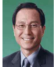
박 상 돈 (前감사·연구실장/국회의원)