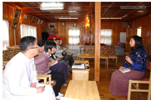
<부탄연구센터 전경 및 회의모습>

부탄은 국민 1인당 GDP가 낮은 저소득 국가이다. 하지만, 부탄에서는 「당신은 행