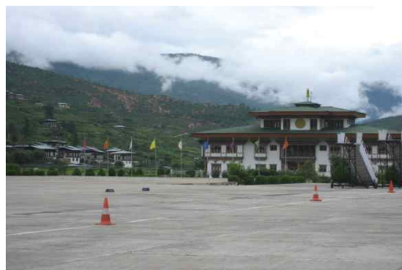
<부탄으로 들어가는 유일한 항공기 드룩에어와 파로공항>

여행자에게 부과되는 여행세는 호텔에서 묵든 트레킹을 떠나든 US$200이다. 이 금액은 모든 숙소와 음식, 부탄 내의 육로 교통수단, 가이드, 포터, 짐 나르는 동물, 그리고 문화 프로그램 등을 모두 포함한 금액이다. 이 금액은 위치, 계절, 그리고 요구하거나 제공된 그 어떠한 숙소 형태와도 무관하게 일률적으로 적용된다.