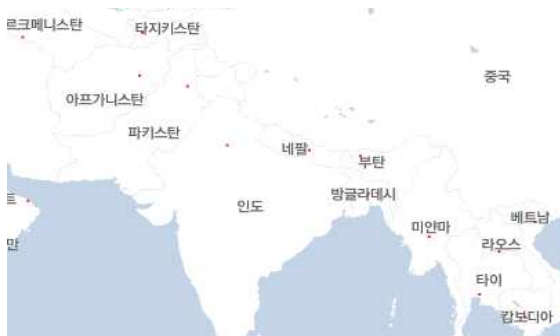
<지도로 본 부탄의 위치>

풍부한 자연 자원에도 불구하고 부탄은 아시아에서 가장 가난한 나라 중 하나로 대두되며 다른 나라와 달리 '어떠한 대가를 치르더라도 발전만을 추구하는' 태도를 피하고 있다. 그들의 주장대로 옛 문화와 자연 자원, 그리고 그들의 불교식 생활양식을 강력하게 보호하고 있는 부탄은 과거와 미래에 양 발을 걸친 채 침착하게 현대화를 추진하고 있다.