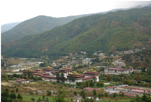
<타시초종 ; 정부종합청사이자 사원>

GNH의 연구 및 적용과 부탄의 경제, 역사, 종교, 사회, 정치, 문화 및 관련 테마를 연구하며 출판과 웹상의 공유를 통해 부탄의 학문을 장려하고, 각종 국내외 회의와 세미나 및 강연 등을 개최한다.