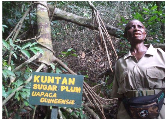
[사진 8] 카쿰 국립공원 안내판(좌)과 국립공원의 당과(糖菓)나무를 설명하는 안내원(우)

탐방객 센터에는 국립공원의 가치, 열대우림 잠식화의 원인, 서식하고 있는 다양한 생물종에 대해 상세한 설명과 함께 탐방객이 직접 만져보고 생태적 질문에 답할 수 있도록 환경교육 차원에서 배려한 흔적이 묻어났다. 그 상황을 보면 교육이야말로 인간의식 변화를 가져올 수 있는 중요한 방법이며, 아이들이 일찍 학교에 가는 모습만 보더라도 이 나라의 장래가 밝고 탄탄함을 보여준다.