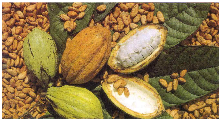
[사진 2] 초콜릿의 원료가 되는 카카오열매

결국 보고서는 아프리카 지역의 광대한 토지들은 보기와는 달리 비옥한 토지이며, 단지 관개시설의 미비와 이를 뒷받침할 수 있는 정치체제가 갖춰지지 않아 식량을 계속해서 다른 지역에서 수입해야 하는 악순환을 반복하고 있다고 지적한 바 있다.