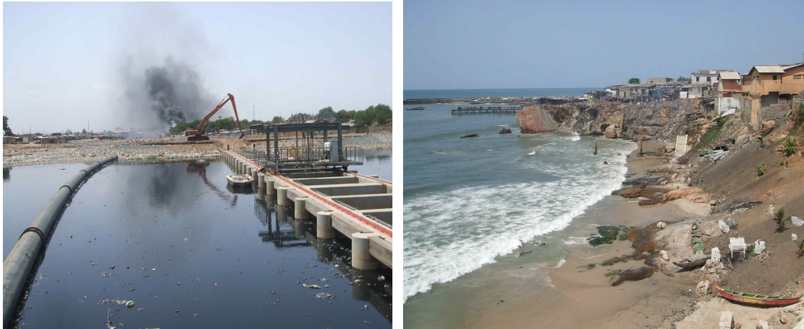
[사진 6] 콜레 라군 생태복원 사업의 유입수 차단시설(좌)과 아크라 해안침식에 의한 유실(우)

편 기후변화의 영향으로 노예해안에 위치한 망루가 해안침식에 의해 유실되었고, 수변구역에 위치한 건물이 무너져 내린 흔적을 볼 수 있다. 그래도 해안에서는 중학생들이 축구를 하는 모습을 보면 사람들이 낙천적이고 우리 한국 사람에 대해서도 우호적인 자세를 보인다.