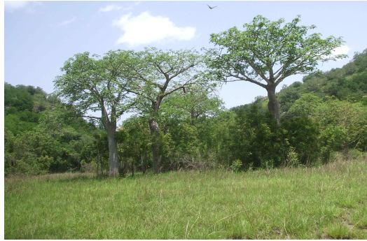
[사진 3] 샤이 자원보호구역의 바오밥나무

1892년까지 샤이족이 거주하던 곳으로 도기, 유리구슬 공예품, 코끼리와 야생들소 뼈 조각이 발견되었다. 그 외에 31종의 포유류, 175종의 조류, 13종의 파충류 이외에 원숭이 등의 중요한 서식지 기능을 갖고 있다.