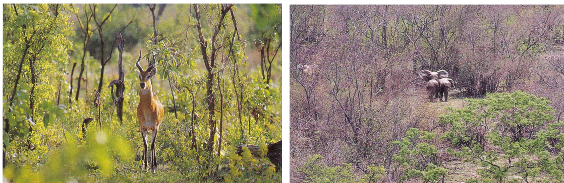
[사진 7] 사반나지역의 붕고 영양(좌)과 카쿰 국립공원의 숲코끼리(우)

아크라에서 서북쪽으로 200km 떨어진 카쿰 국립공원은 면적 357km 2 이며 1932년에 지정되었다. 이곳은 최고 90여m에 이르는 거목 열대우림지역으로 생물종의 다양성을 직접 느끼고 자연의 경이로움을 체험할 수 있는 곳이다. 희귀한 나비, 조류, 사냥감 이외에 붕고영양, 숲코끼리 등이 있는데 코끼리가 나무에서 떨어지는 과일을 주워가는 모습도 볼 수 있다. 지상 30-40m 높이로 설치된 닫집관찰로(canopy walkway)는 쇠줄과 그물망으로 거목사이를 연결하고 있는데 못으로 박은 흔적이 없었다. 그만큼 훼손을 최소화하도록 설계하였고 탐방객이 유격훈련하듯 천천히 거닐며 자연의 위대함을 맛볼 수 있다.