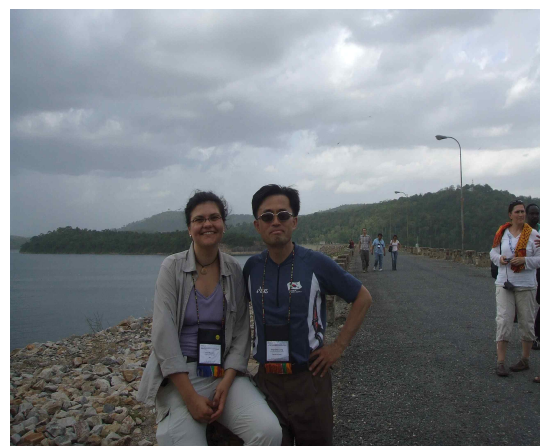
[사진 4] 아코숨보댐 수력발전 설비(좌)와 볼타호의 아코숨보댐에서(우)

수도 아크라라는 대서양에 연한 도시로 고층빌딩이 적고 나지막한 건물이 숲