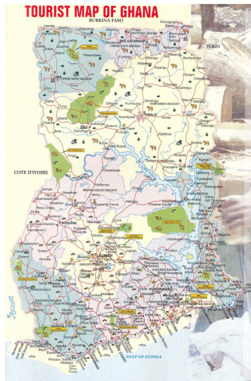
[그림 1] 가나의 여행지도

지고 이와 관련된 사업을 개발·추진하기 위해 다방면의 노력을 기울이고 있다는 점이다. 특히 기후변화 및 CDM관련 유관 정부기관들은 외국인투자를 유치하기 위해 적극적으로 자국의 기후변화정책 및 투자환경에 대해 홍보하고 있다. 가나에서는 폐기물매립지와 CDM 연계사업을 비롯하여 전통적 농업국가의 특성상 자트로파 등 바이오디젤 연료 생산사업 등에 큰 관심을 가지고 각 부문에 대한 외국인투자를 유치하기 위해 노력하고 있다. 아프리카에서 기후변화 및 CDM 관련사업을 개발하고 당사국간 공동연구의제를 도출하기 위해서는 협력 채널확보가 요구된다. 따라서 각국의 관련 전문가들과 정보 및 인적교류 활동을 통해 지속적으로 기후변화분야의 협력의제를 개발할 필요가 있다.