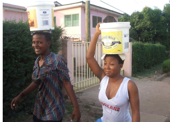
[사진 5] 아크라 해안의 청소소년축구단(좌)과 아크라 교외의 우물물 나르는 여인(우)

아크라는 식민지시절 노예 수출의 거점도시였으므로 내륙에서 끌고 온 노예들의 집결지로, 지금도 노예감옥이 남아있다. 역사의 아이러니이지만 노예감옥이 지금은 관광객의 방문지로서 인간의 존엄성과 역사의 엄중함에 대해 교훈을 주는 곳이다. 그래서 아크라의 옛 시가지는 오래된 낡은 집과 좁은 길, 혼잡한 거리 등으로 아프리카다운 느낌을 준다. 지금은 도시재생 사업과 미처리하수로 오염된 습지 복원작업이 진행 중에 있으나 워낙 사회간접자본이 부족하고 수질이 나빠 환경정화에는 많은 시간이 소요될 전망이다. 콜레라군(Korle Lagoon) 복원지역의 경우 부유쓰레기를 차단하는 차단막과 수처리 시설을 설치하고 있으나 제대로 가동되지 못하고 있다. 호소습지의 수질은 과거 난지도 매립장 침출수 수준인데 혐기성 분해가 일어나고 있어 악취가 심하다. 그런 가운데에도 망그로브 나무는 호소 주변에 자라고 있고, 나무에는 새들이 곤충 등을 잡아먹으며 생명을 유지하고 있다. 수질이 개선되고 호소와 바다가 연결되어 물 순환이 원활해지면 점차 개선될 전망이다. 한