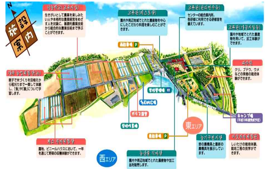
〈그림 2〉 낙농생활센터의 주요 시설 배치도

樂農생활센터는 도시민에게 농업을 체험하고 접할 수 있는 기회를 부여하는 거점시설로서의 역할을 담당하는 것이 주된 목적이며 아울러 농업활동에 실제 참여하려는 사람에게 도움을 제공하는 교육시설로 활용하는 목적도 지니고 있다. 지산지소(地産地消) 개념의 레스토랑 운영을 통해 지역에서 생산한 농산물을 도시민에게 제공하고 지역의 먹을거리의 중요함을 인식하도록 유도하기도 한다.