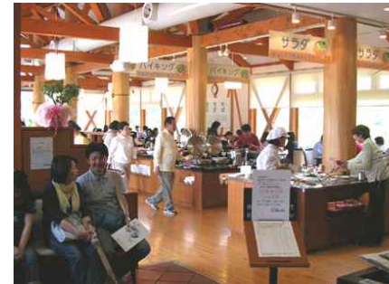
〈사진 3〉 지산지소 방식의 레스토랑(좌)과 주민이 운영하는 직판장(우)〉

地消)원칙으로 재료를 공급하는 데 역점을 두고 있다. 재료의 30%는 센터 내 농장 및 인근 고베 권역 내에서 공급하며, 20%는 효고현 내의 재료를 활용하는 것이다. 다른 현의 재료가 차지하는 비중은 50% 정도가 된다. 체험농장이나 가공시설에서 생산된 식재료 역시 레스토랑에서 소비한다. 음식물 쓰레기는 100% 퇴비로 활용할 수 있도록 퇴비 생산시설을 갖추고 있으며, 폐식용유 역시 바이오디젤로 재사용하여 트랙터 등에 일부 사용하고 있다.