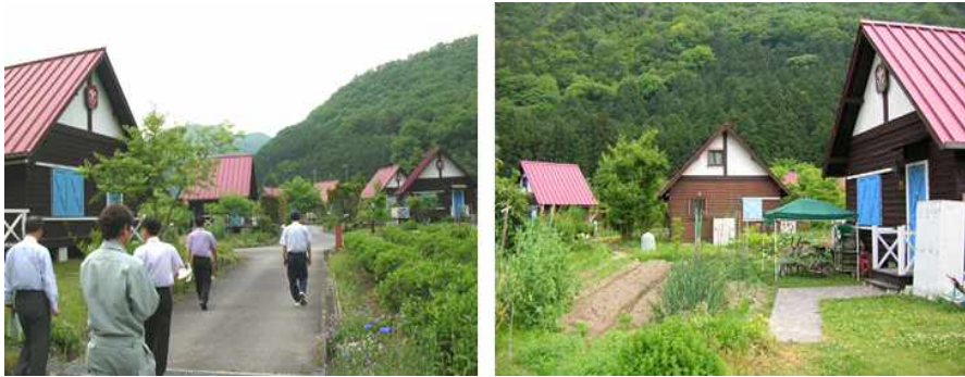
〈표 1〉 다까정의 체재형 시민농원 현황