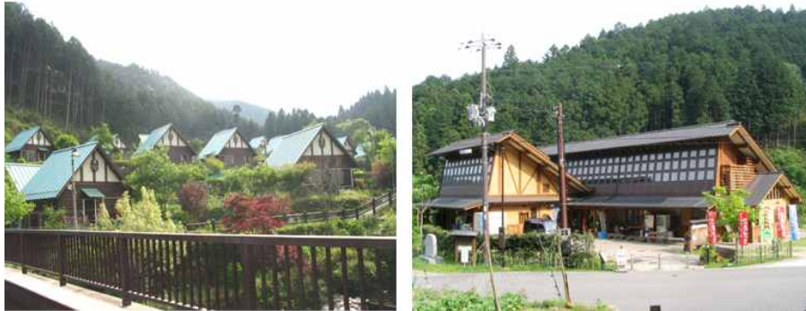
〈사진 2〉 블라이벤 오오야와 커뮤니티센터

우는 지역 주민들과 입주자들이 주말에 맞추어 공동으로 각종 행사나 이벤트를 벌이기도 한다.