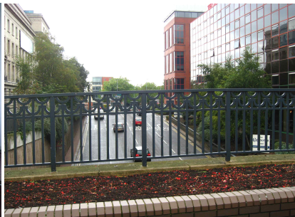
[그림 6] 지상의 차도를 지하화하고 보행로 조성