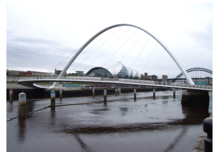
[그림 14] 뉴캐슬과 게이즈헤드를 연결하는 밀레니엄 브리지