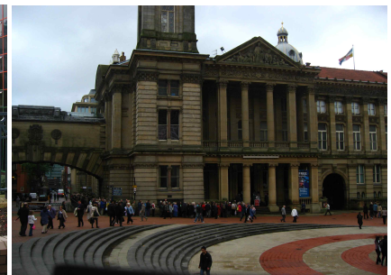
[그림 4] 라운드 어바웃을 광장화함