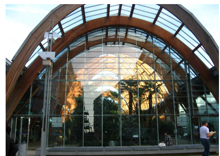
[그림 10] 공공공간의 확충 : 원터가든 (도심부에 부족한 공공공간 및 녹지공간을 확충하고 다양한 위계의 보행공간과 연결)