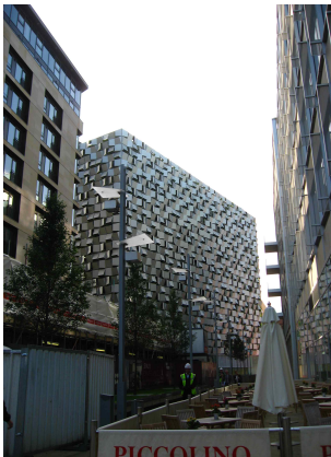
[그림 8] 혁신적 디자인의 주차장