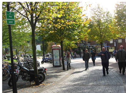
[그림 9] 자동차도로가 보행로로 변화