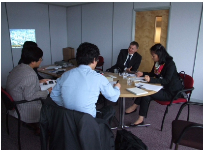
[그림 5] 버밍햄 시청 담당자와의 인터뷰