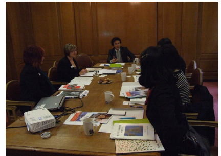
[그림 11] 맨체스터 시청 담당자와의 인터뷰