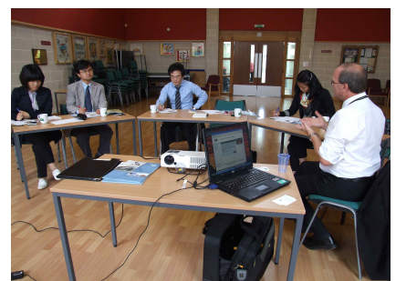
[그림 7] 캐슬베일 지역코디네이터와의 인터뷰