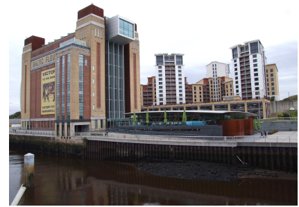
[그림 13] 제분공장을 리모델링한 발틱 미술관