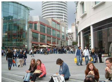
[그림 1] 브린들리플레이스(좌) & 불링(우)